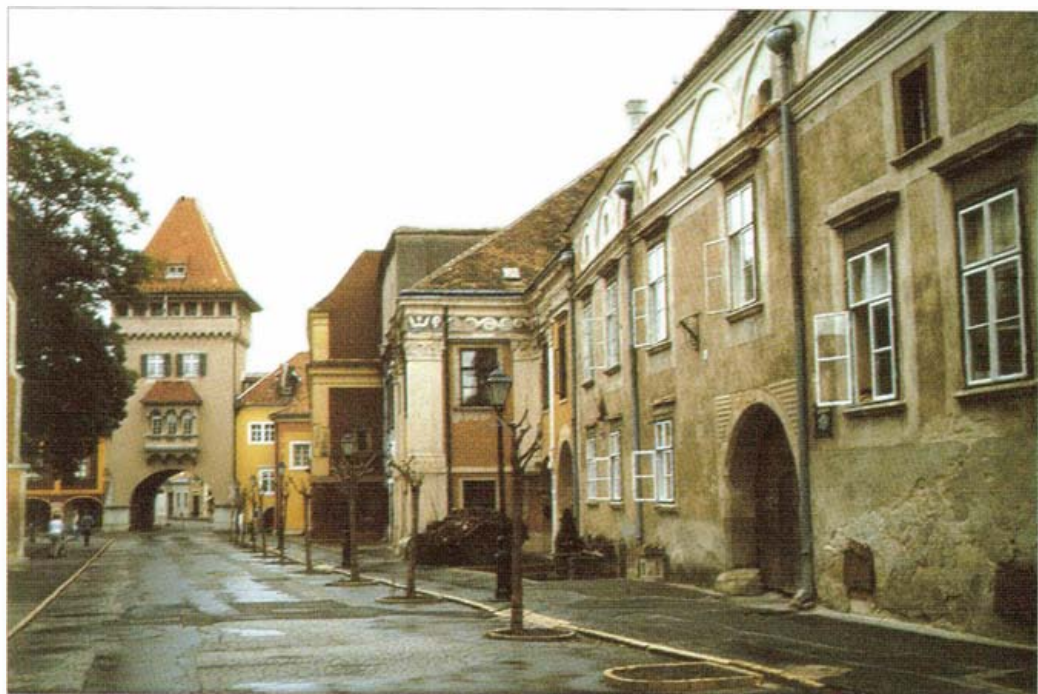
A Jurisich tér, háttérben a Hősök tornya