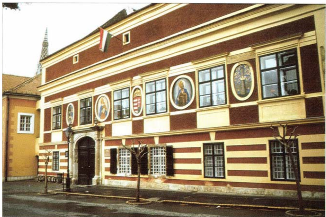
A késő reneszánsz városháza