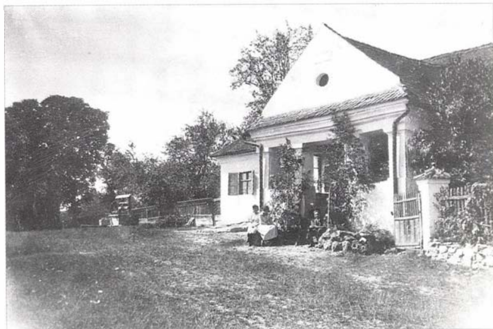
A Vass-porta az 1800-as évek végén