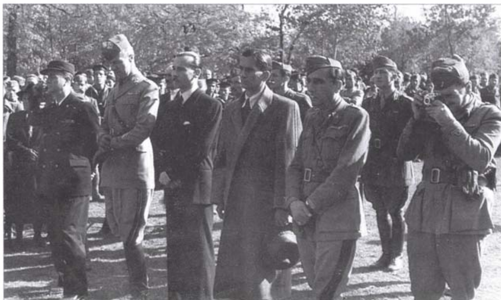
A dácai olasz táborban (levett kalappal)

1945 tavaszán bekapcsolódott a politikai életbe, belépett a Független Kisgazdapártba, kapcsolatba került annak vezetőivel – Tildy Zoltánnal, Nagy Ferencsel, Varga Bélával és másokkal –, s úgy alakult, hogy indul az 1945-ös képviselőválasztásokon. 1945. október 16-án írta alá a képviselővé választásának igazolását Kovács Béla országos főtitkár és Nagy Ferenc országos pártelnök. Ekkor már az újjáépítés államtitkára volt. 1945. május 18-án Veszprémben a Petőfi Színházban tartott kisgazdapárti nagygyűlésen, mint építésügyi miniszter, ő volt az egyik előadó. Beszédében – többek közt – kiemelte, hogy az újjáépítési tervet saját erőnkből meg tudjuk valósítani, de nem zárkozunk el a külföldi kölcsönöktől sem. A 3 éves terv megszünteti az agrárrollót, de a terv nem bántja a magántulajdont.