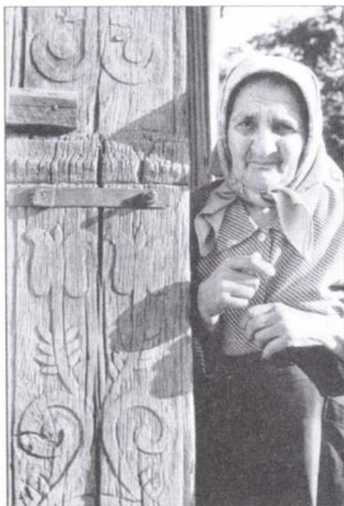
Ragaszkodó (Máréfalva, 2000.)