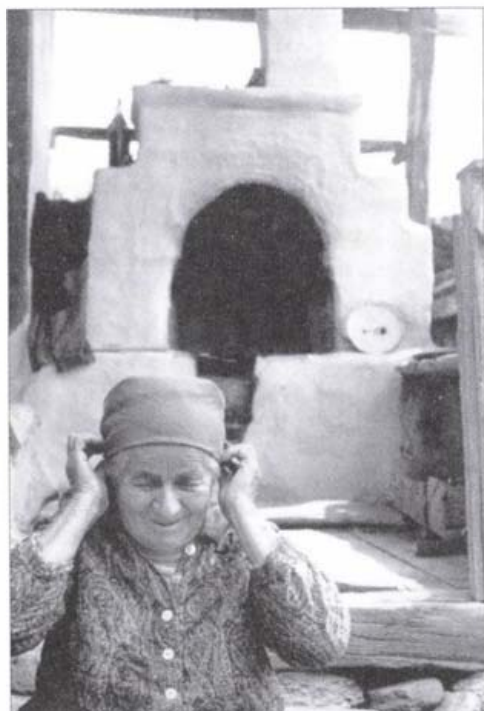
Gazdasszony (Farnas, 1998.)