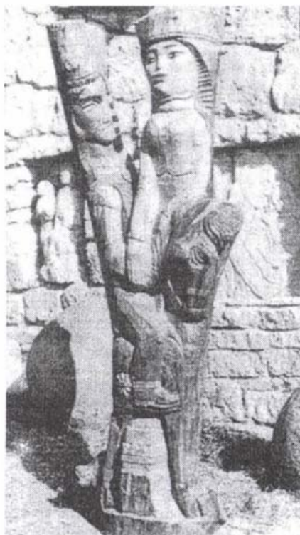
Szervátiusz Jenő: A fából faragott királyfi (szilfa)