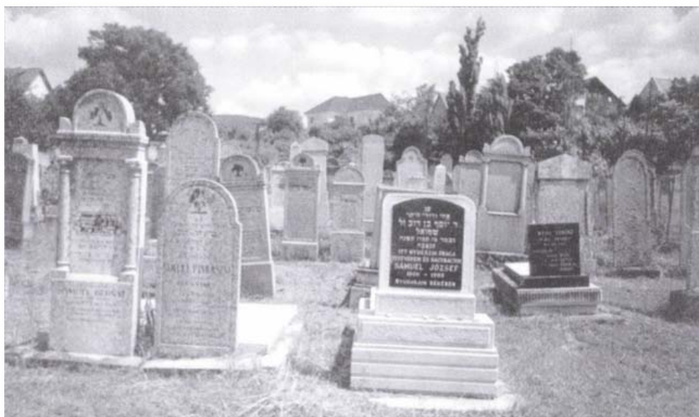
Az ortodox temető

165 centiméter mélyre helyezték. A sírköveken a törzs szerinti jelképeket, zsidó kultikus tárgyakat – gyertyatartókat, mécseseket –, valamint fűzfa és galamb motívumokat ábrázoltak. Az áldásra kiterjesztett kezek a kohanita, a kancsó, a kézmosótál a levita származásra utal. A feliratok héber és német–német nyelvűek voltak.