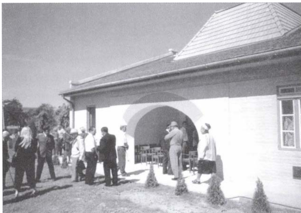
Ima- és közösségi terem a deákvári temetőben. Mártír istentisztelet 2002. június 30.