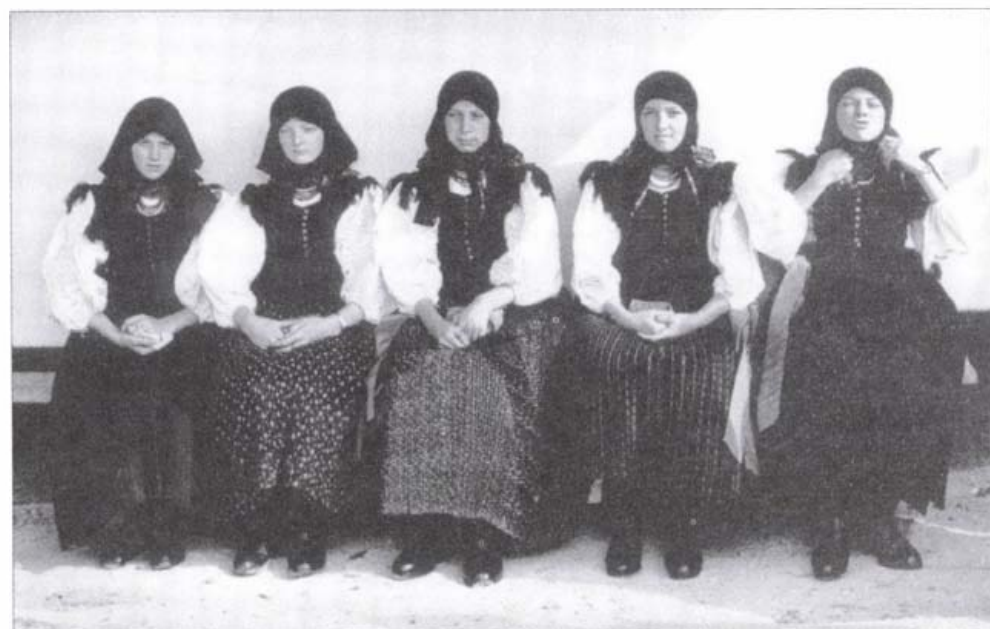
Eseményre várva (Szék, 1984.)