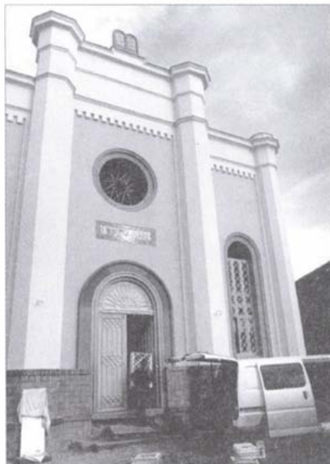
A váci zsinagóga felújított homlokzata, 2002 novemberében (Kováts Zsolt felvétele)

Feljegyzések vannak egy régebbi temetőről, amely Kosd irányában két és fél kilométerre a várostól, Cselőtepusztán volt. Ez ma már nincs meg. Később két sírkert létesült a városban. Deákváron egy neológ jellegű, majd Kisvácon az ortodoxia részére. Ma mindkettő gondozott, helyi védettség alatt áll. A sírköveket naszályi mészkőből faragták, a koporsókat átlagosan