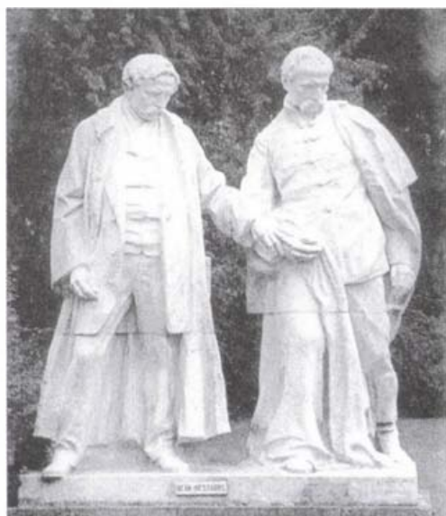
Deák Ferenc és Mészáros Lázár szobra Dombóváron