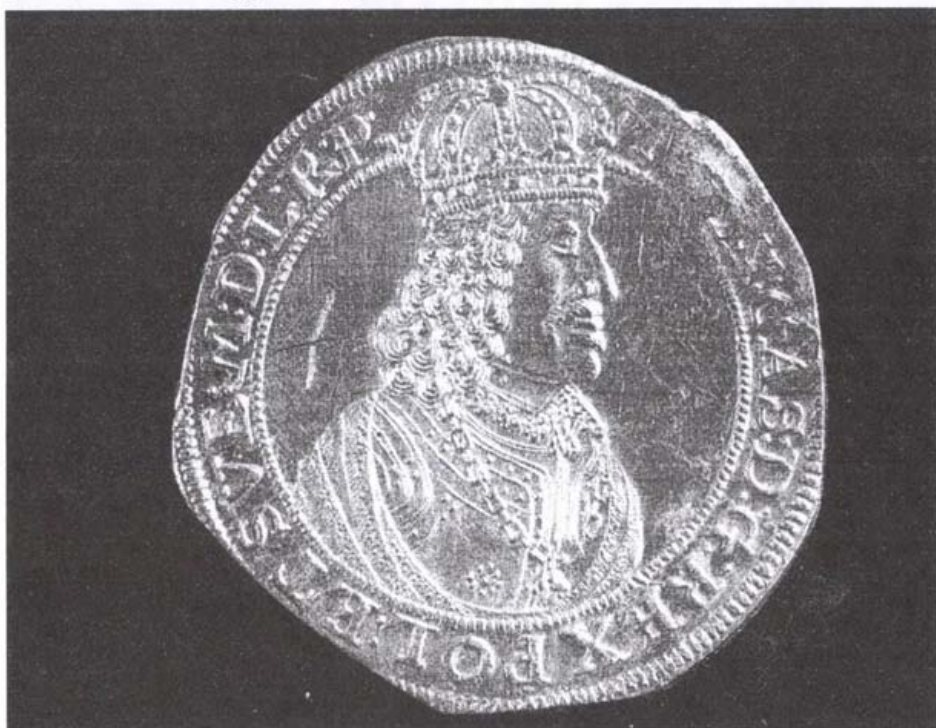
János Kázmér lengyel király thorni 4 dukátosa (unikum), 1655.