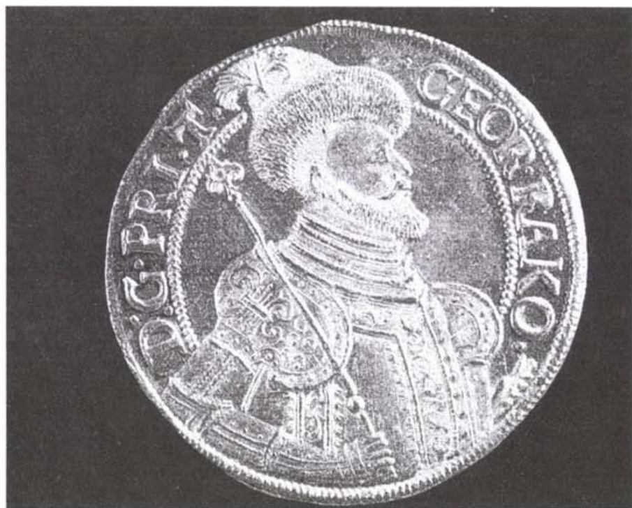
II. Rákóczi György 10-szeres aranyforintja, 1628