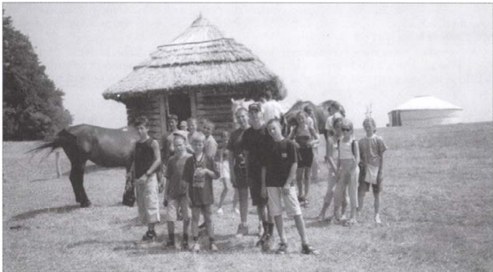
Kisrozágyon a honfoglaláskori emlékparkban

Iskolánkban kilencedik éve szervezünk honismereti táborokat. Kezdetben nyaranta csak egy napközis jellegű táborra futotta lehetőségeinkből, míg az utóbbi négy évben egy napközis jellegű – kisebb költségű – 5-6 napos és egy bodrogházi 7-8 napos tábort valósítottunk meg. Annak ellenére, hogy iskolánk és az egyházak tanulóink számára tartalmas nyári időtöltést