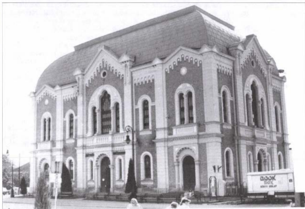
A kisvárdai zsinagóga