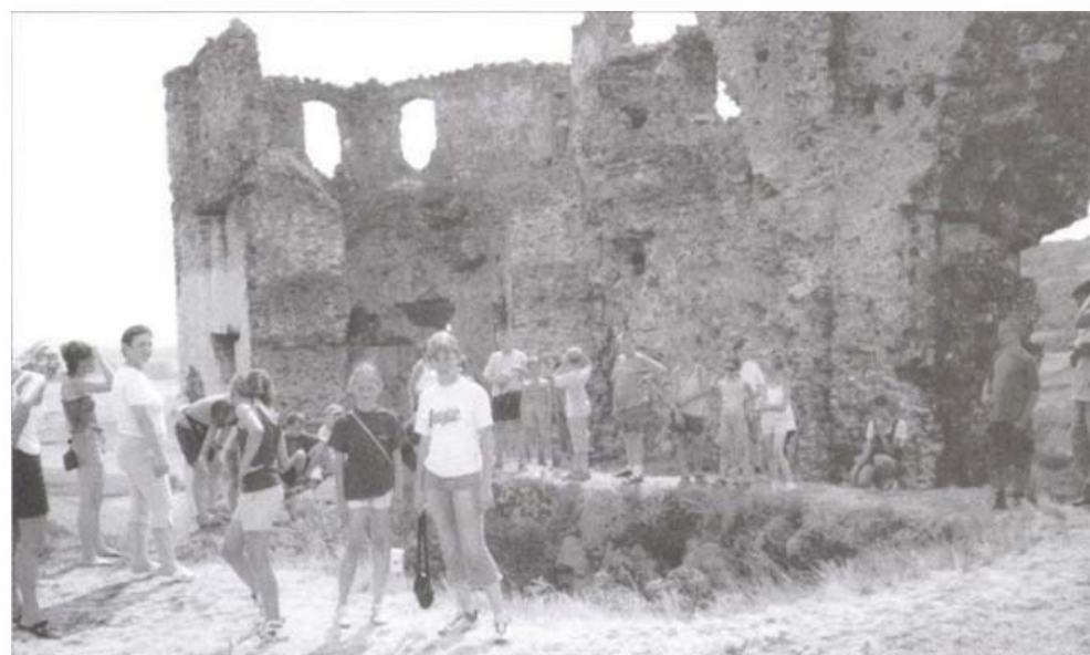
A nagykövesdi vár romjainál

Tapasztalataim szerint azok a tanulók vesznek részt elsősorban a honismereti táborokon, akiket megérintettek a harmadik és negyedik osztályos olvasókönyvekben található történel-