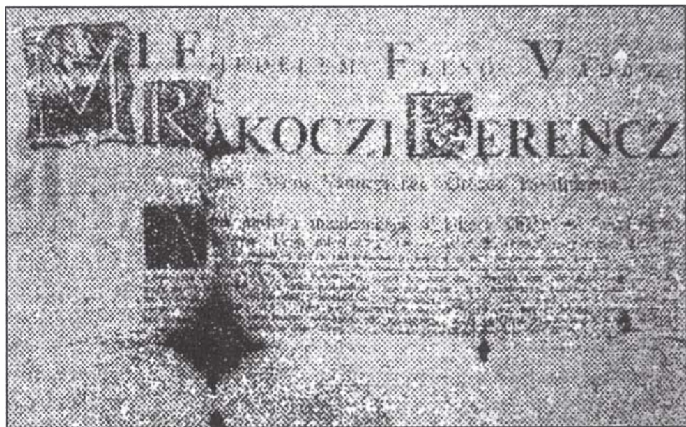
Szőny község (ma Komárom) kiváltságlevele II. Rákóczi Ferentől

Bottyán 1705 őszén nyílt levelet bocsátott szét, melyben meghódolásra hív fel mindenkit: „Én Bottyán János, Méltóságos Erdély- és Magyarországi Fejedelem Felső-Vadászi II. Rákóczi