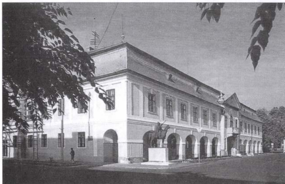
Bottyán generális lovasszobra Esztergomban, Martsa István alkotása. Mögötte a Városháza, a kuruc vezér egykori palotája. (Képes körséta Komárom-Esztergom megyében. Tatabánya, 1992.)

zetbe jutott, hogy már egész Magyarországon majd mindenütt dühöngő zavargóknak káros és veszélyes munkájából hasonlóan ki lesz téve... azon veszedelemnek és csapásnak, hogy vezetőik tűzzel-vassal, végpusztulással való fenyegetésekkel megadásra bírják és szorítsák; azért czélszerűnek, sőt szükségesnek tartottuk, hogy ezen végszükségünktől kényszerítve, fennmaradásunkra nézve megfelelő módon, közakarattal és elhatározással... ő legszentebb felsége koronás királyunk és legkegyelmesebb urunk sérelme nélkül a következőket határozzuk: