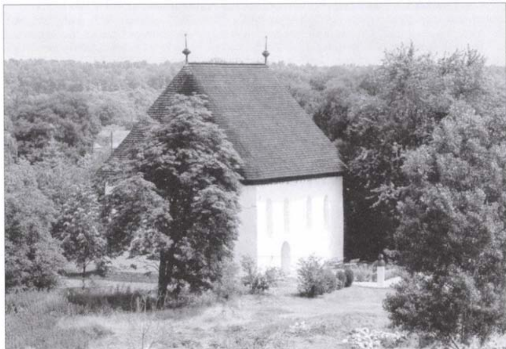
Szabolcs, református templom