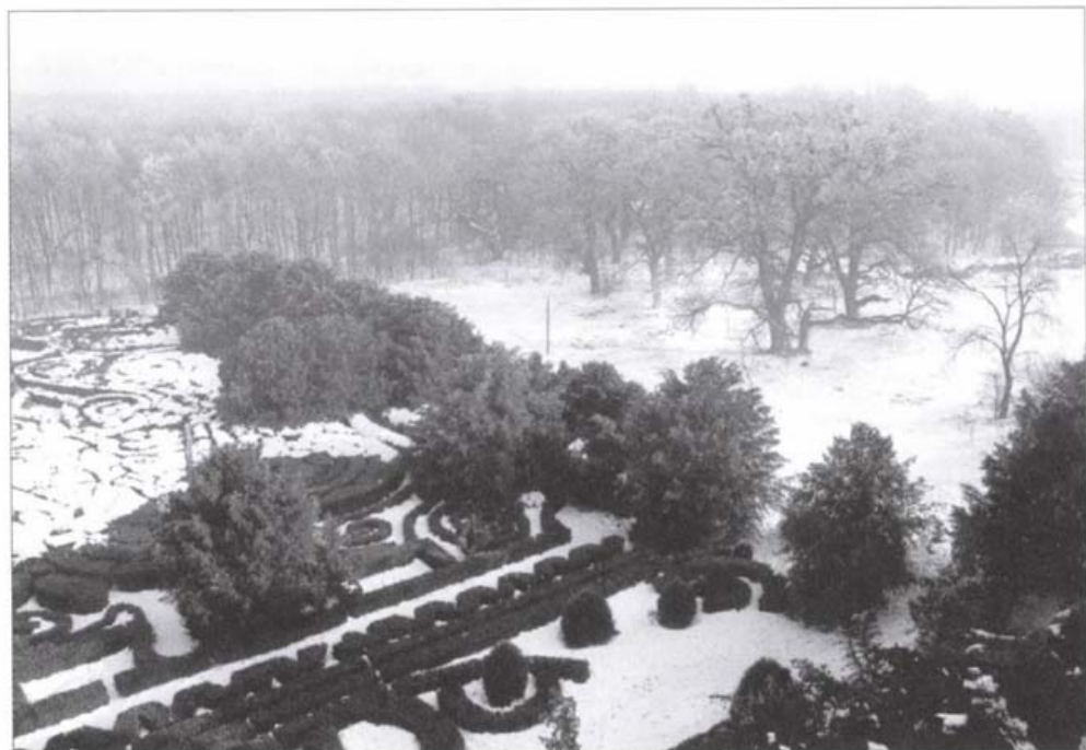
Andrássy-kastély angolkertje, Tiszadob