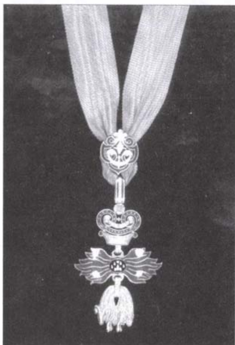
Az aranygyapjas rend jelvénye