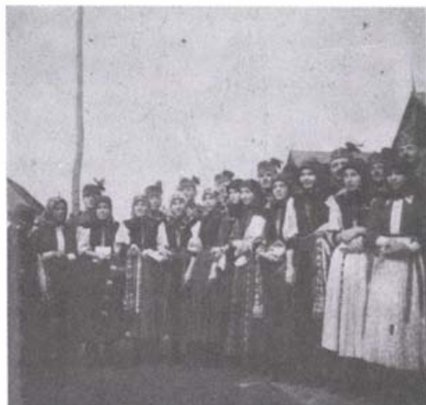
Körösfő 1940. 10. 6.

indítunk útba, hogy 6-án 18 és 19 óra között megérkezzenek a kijelölt helyre. Annyi embert küldünk, hogy 500 méterenként jusson egy 2 fős járőr. Az emberek zöme csendőrökből fog állni, de sok katona is lesz köztük. Esetleges további parancsokat Csucsán fog kapni.”