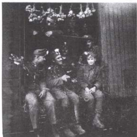
Kisújszállás. Indulás Erdélybe. 1940. 09. 5.