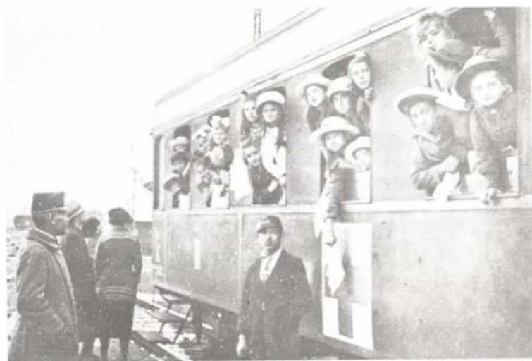
Hollandiából érkező magyar gyerekek (BTM-Kiscelli Múzeum. Ltsz.: 13602-28)