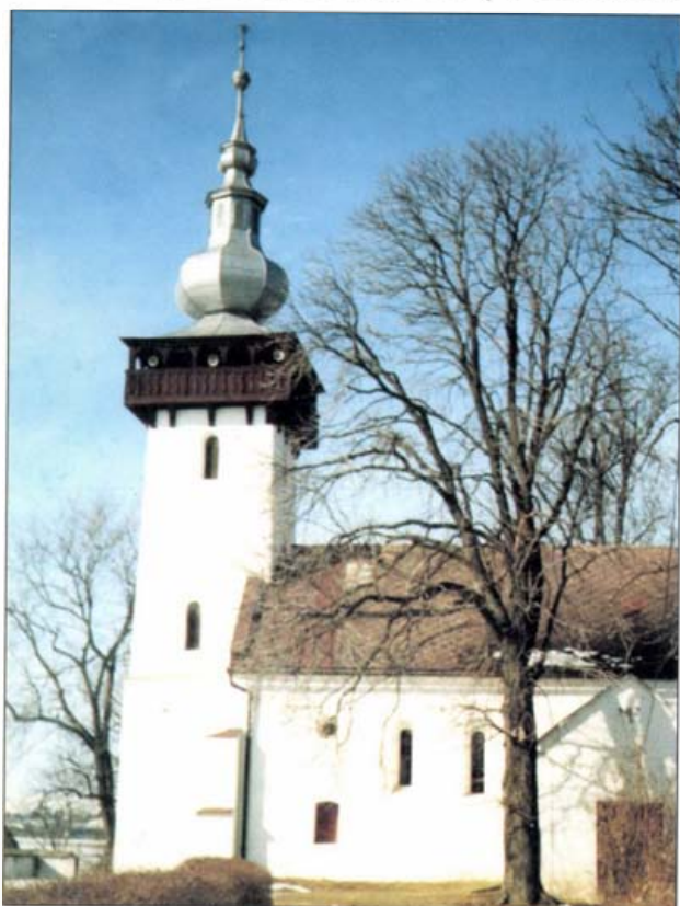
A serki református templom