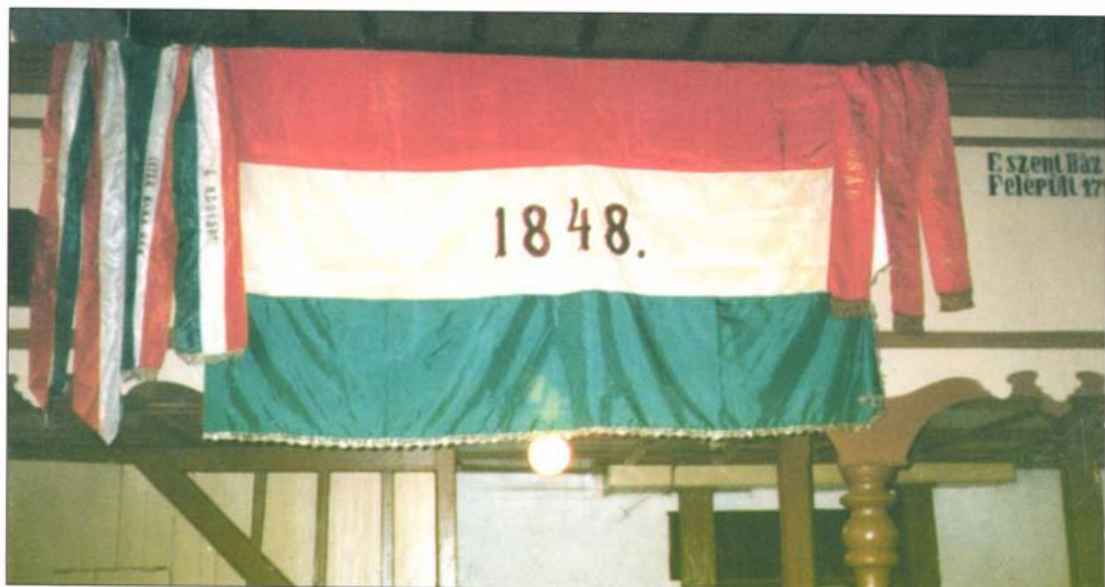
A serki paplakban talált 1848-as zászló