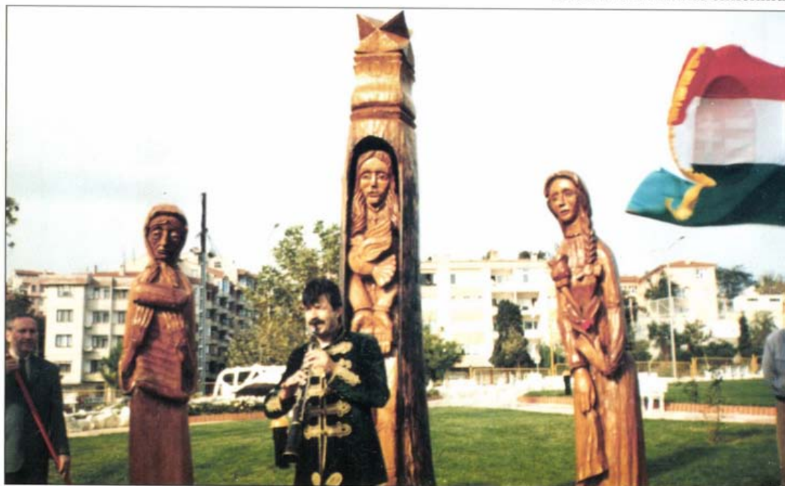
Mónus Béla Mikes emlékmű