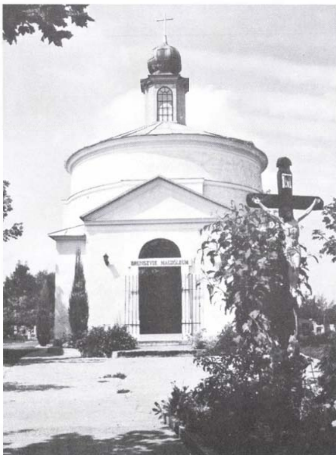
Brunszvik Mauzóleum, Martonvásár

Helyesbítés Molnár Márta : Brunszvik Teréz emlékezete című, a Honismeret 2000. 5. számában megjelent cikkéhez. Brunszvik Teréz , a közép-európai viszonylatban is legelső óvodák alapítója 1861. szeptember 23-án valóban Vácdukán hunyt el, 27-én, azonban nem ott, hanem Martonvásáron kísérték utolsó útjára. Koporsója a családi mauzóleum alsó, kriptá részében található.