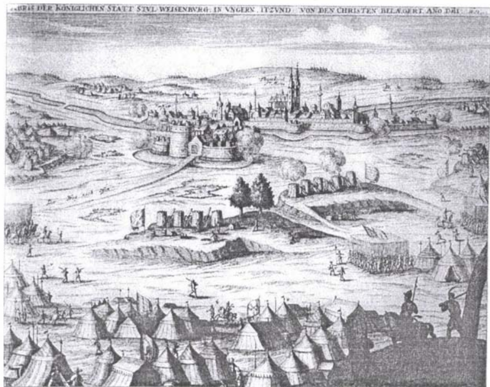
Székesfehérvár ostroma 1601-ben. A keresztény seregek visszafoglalják a várost a törököktől. Ismeretlen német mester rézmetszete 1721-ből (Szent István Király Múzeum)

őrizte századokon át. A kapu sík átmetszete a mai városképen is érzékelhető. A Palotai kapu első formájában a korai várvédelemnek megfelelő építmény volt. A falból erősen előreugró bástyarendszer a kaput esetleg betörő ellenséget fokozatosan eresztette át (csapóhíd, rácszat). A védők erősen zaklathatták a behatolókat az első szint padlórésein keresztül. Erre végül is sohasem került sor, mert Fehérvárt soha nem vette be ebből az irányból ostromló sereg. 1601-ben a vár korszerűsítésekor ezt a bástyát és kaput is átépítették.