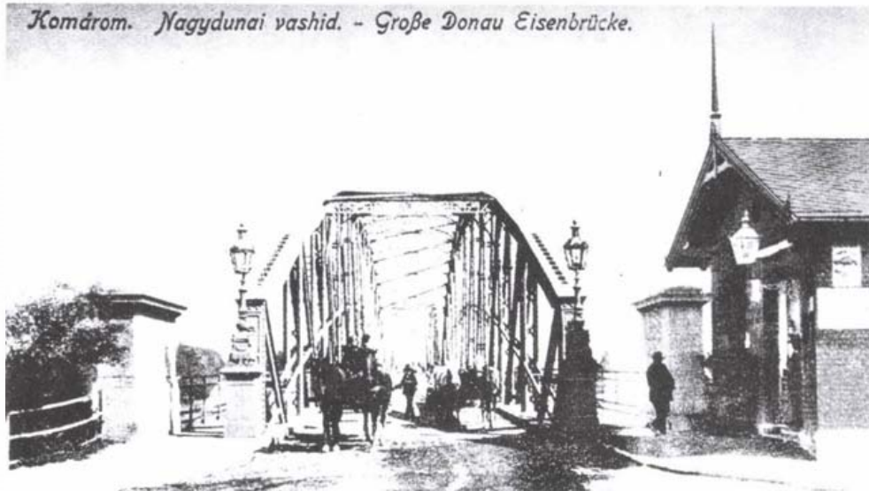
Komárom. Nagydunai vashíd. – Große Donau Eisenbrücke.