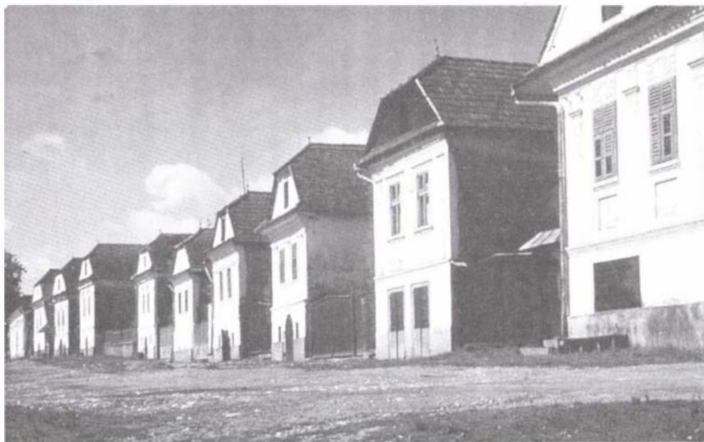
Torockó, felső piacsor

A vesztes első világháború után az erdélyi magyarság teljesen magára maradt, e kiszolgáltatott helyzetben a magyarság számára az egyetlen reményt a nemzetek önrendelkezési jogát kinyilvánító wilsoni elvek jelentették. (Később kiderült, hogy ezeket a demokratikus elveket