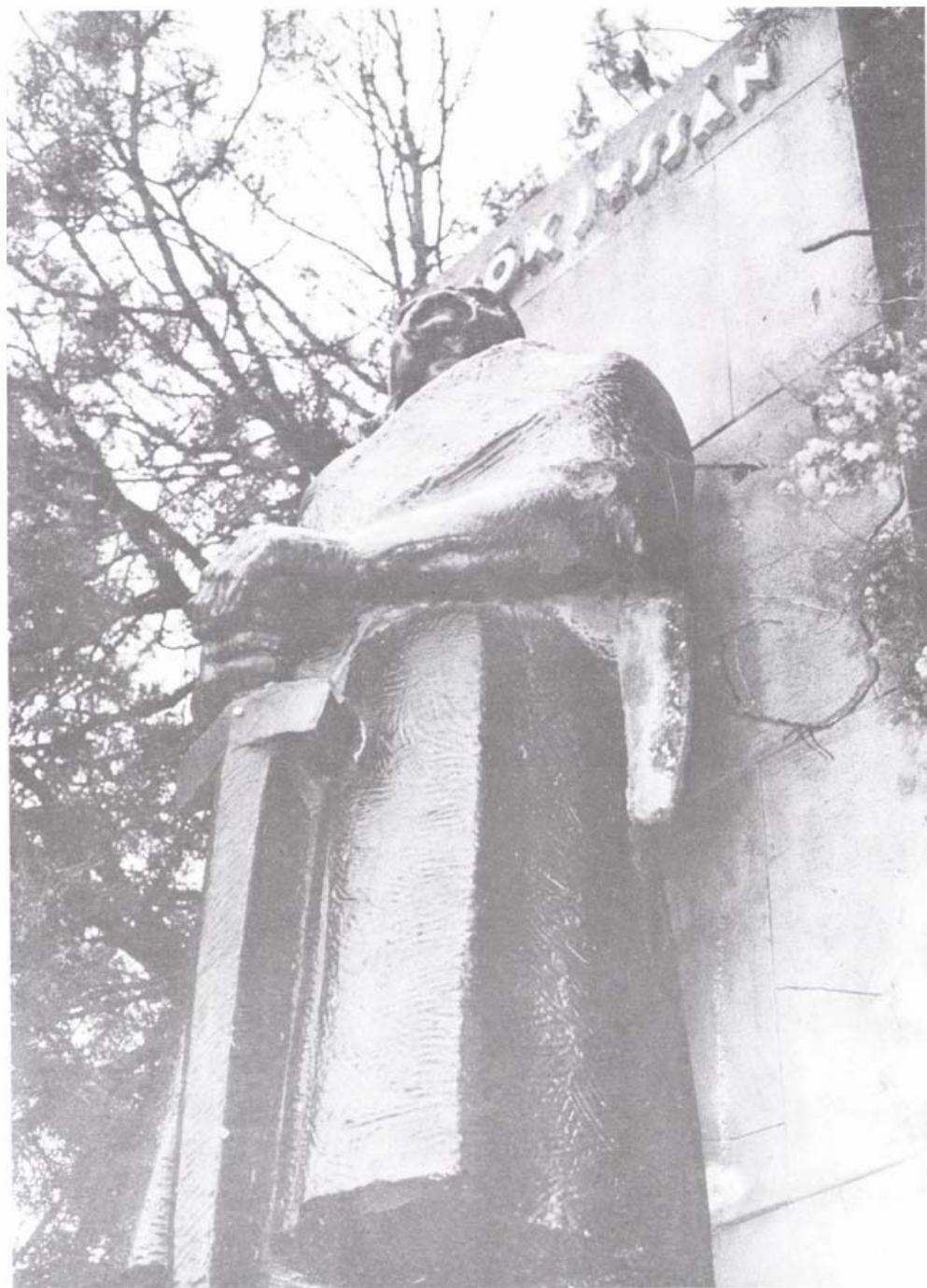
I. világháborús emlékmű, Laskó, 1999. (A szobor a pécsi Zsolnay gyár készítménye, a zománcos kerámia test világháborús és friss golyónyomokat őriz.)