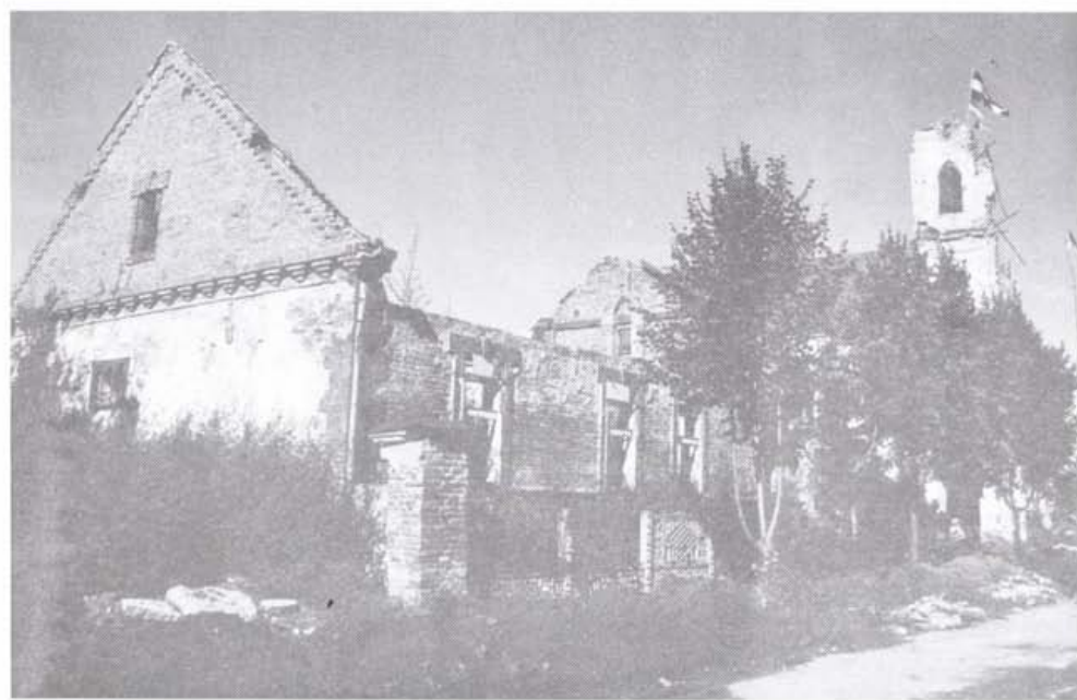
Református parókia, Szentlászló, 1998.

A háború és a megszállás után jártunk ezen a vidéken, hogy a nagy vihar után számbavegyük a megmaradt egyházi értékeket és épületeket. Amilyen megdöbbentőek a pusztulás méretei és képei, olyan felemelő az újjáépítés erőfeletti igyekezete. Az elűzöttek egy része is visszaköltözöben, vagy legalább nappalra, építeni hazajön. A kertek alatt még ott a sárga szalag. Minden bozót halálos aknáat rejt, de újra szántani és vetni akarnak, hogy meginduljon az élet. Ott jártunk a Drávaszögben és Szlavóniában, ahol néhány évvel ezelőtt a magyarok és a horvátok ellen fellázított szerbek ezt üvöltötték: Baranya szerb föld a Balatonig. Itt minden a miénk! és kirabolták, szétlőtték, felgyújtották a templomokat, parókiákat, otthonokat, amiket nem ők építettek. Elpusztítani szándékoztak ezeréves kultúránkat. A református és katolikus templomokat azzal a hamis szándékkal lőtték szét, vagy jóval a háború után azért gyújtották fel, hogy azokból fényjeleket adnak az ellenségnek. Aknákat vagy kézigránátot, szelídebb esetben halálfejes figyelmeztetést dobtak arra a házra, amelyet kiszemeltek, hogy a megfélemlített család elmenekülése után kirabolhassák. Sokan azért hagyták ott otthonukat, mert, ahogyan egy szemtanú nyilatkozott: ...napirenden van az emberek megcsönkítése, körmönfont