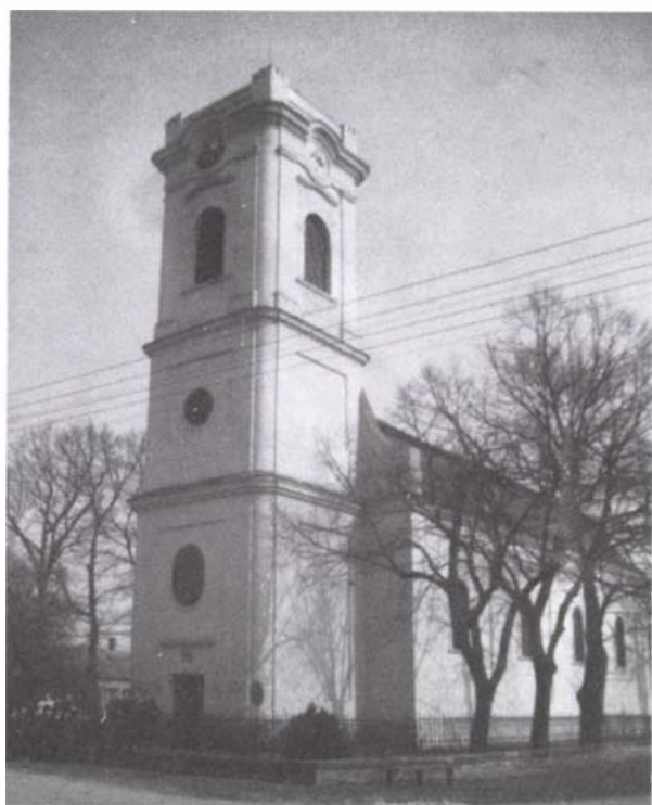
Kismarja, református templom