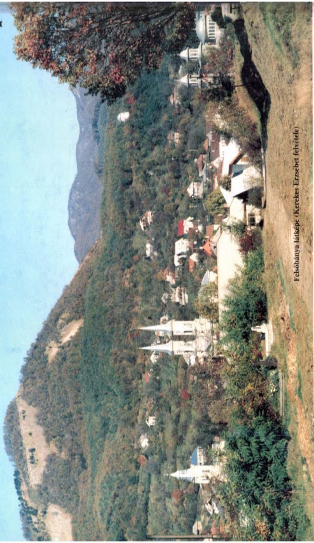
Felsőbánya látképe