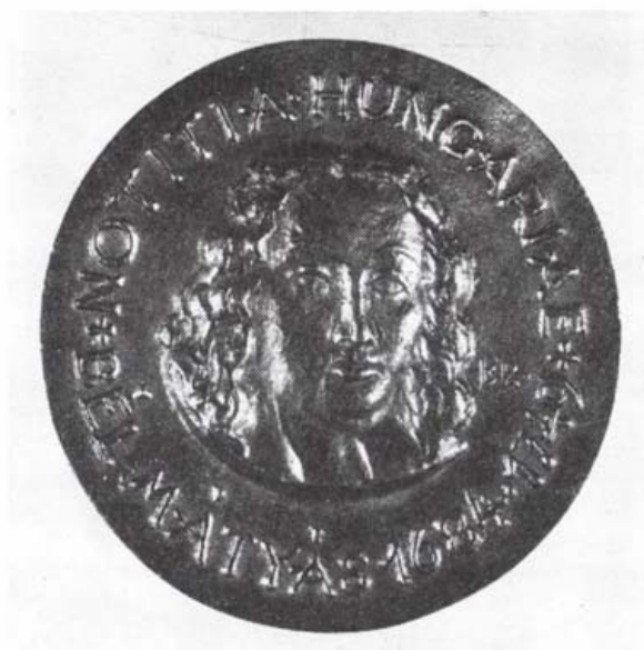
A Notitia Hungariae Emlékérem

Társszerkesztőként, szerkesztőként csaknem két évtizede szerkeszti a miskolci múzeum kiadványait, szerkesztője a Néprajzi Látóhatár című periodikának, tagja az Ethnographia szerkesztőbizottságának.