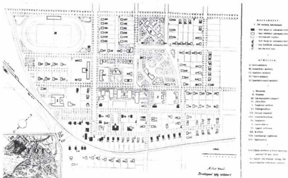
Fót-Újfalu továbbfejlesztési tervrajza