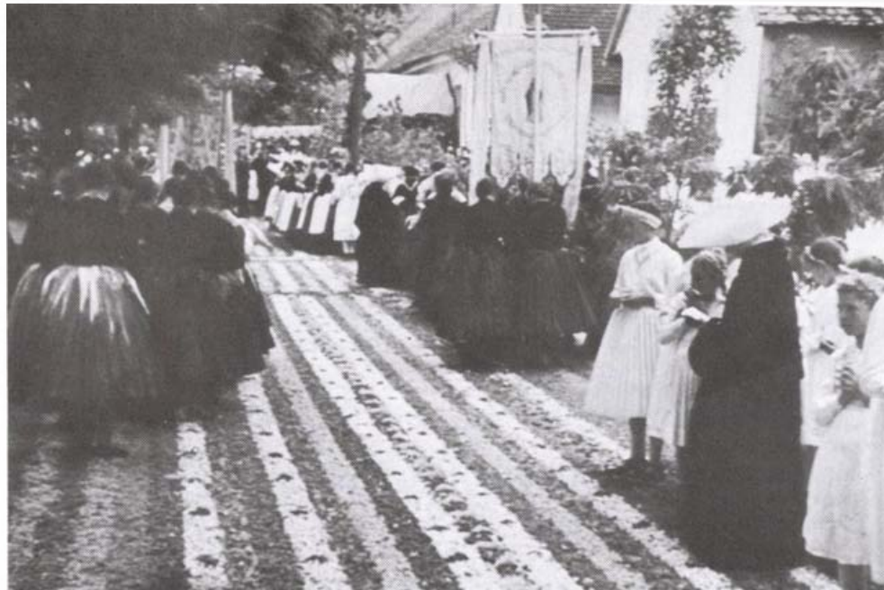
Úrnapi körmenet Budaörsön, 1940-es évek

1946 után tovább élt a hagyomány, a több kilométeres virágszőnyeg azonban összezsugorodott a templom köré (80 m-esre). Jelenleg is ez az útvonala. Adatközlőnk elmondása szerint 1945-ben a körmenetből szedték ki a német férfiakat, 1946-ban a lakosság 90 %-át kitelepítették.