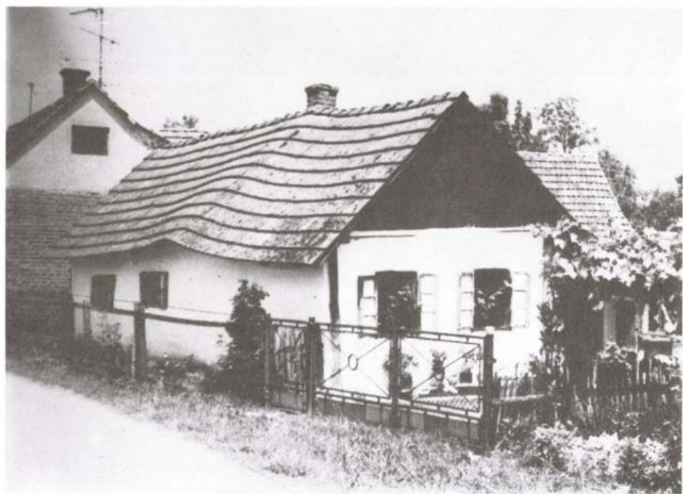
Régi radomosai boronaház