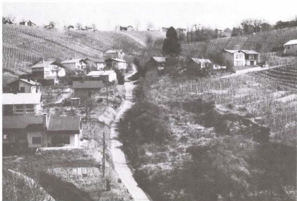
A lendvai szőlőhegy a várból fényképezve