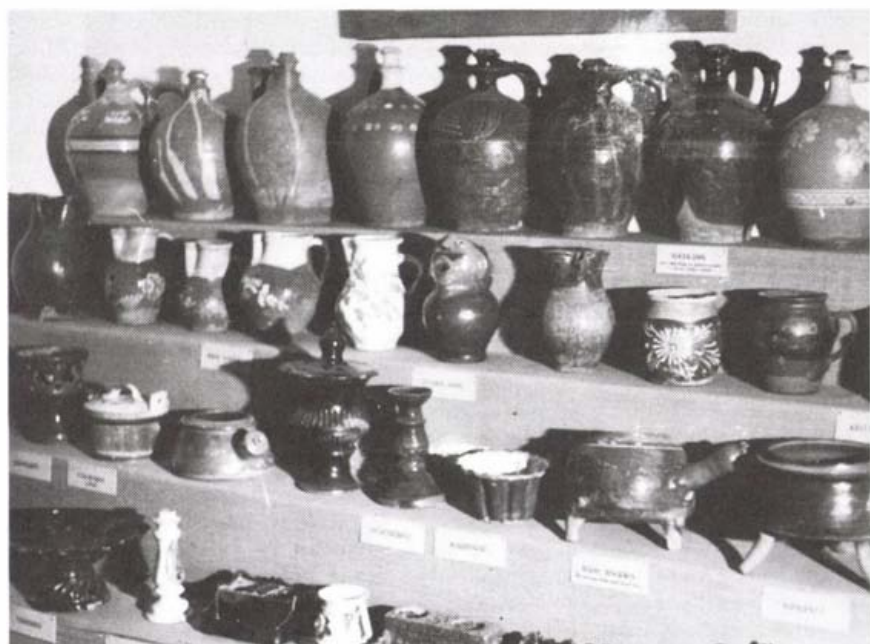
Bugyigás korsók (felső sor) a múzeumban