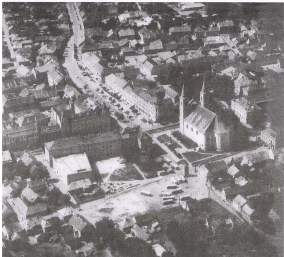
Zalaegerszeg központja 1962-ben

Deákot" örökíti meg. A szobor alkotója a híres Vay Miklós volt. Az emlékmű előtti tér átalakítását éppen most kezdték meg, az öreg, beteg fákat kivágták, rövid időn belül újakat ültetnek helyettük, és a szökőkutat is újra fogják indítani, hogy visszaadják a tér eredeti romantikáját. A hangulatot csak egy szokatlan színűre festett ház rontja el: a rózsaszínű Sóház.