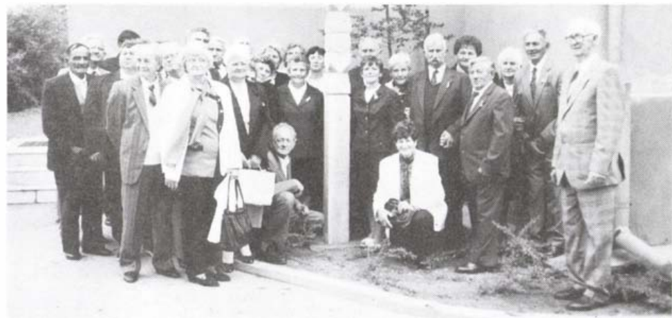
A Félből elszármazottak egy csoportja a kopjafánál

A kétezer lakosú felsőcsallóközi falu lakosainak többsége ma is magyar. Félből 1948. szeptember 12-én 42 család bútoraival, gazdasági felszerelésével és állataival, nemzedékek munkájának mozdítható, még menthető maradványával indultak útnak a vonatok. Az első-