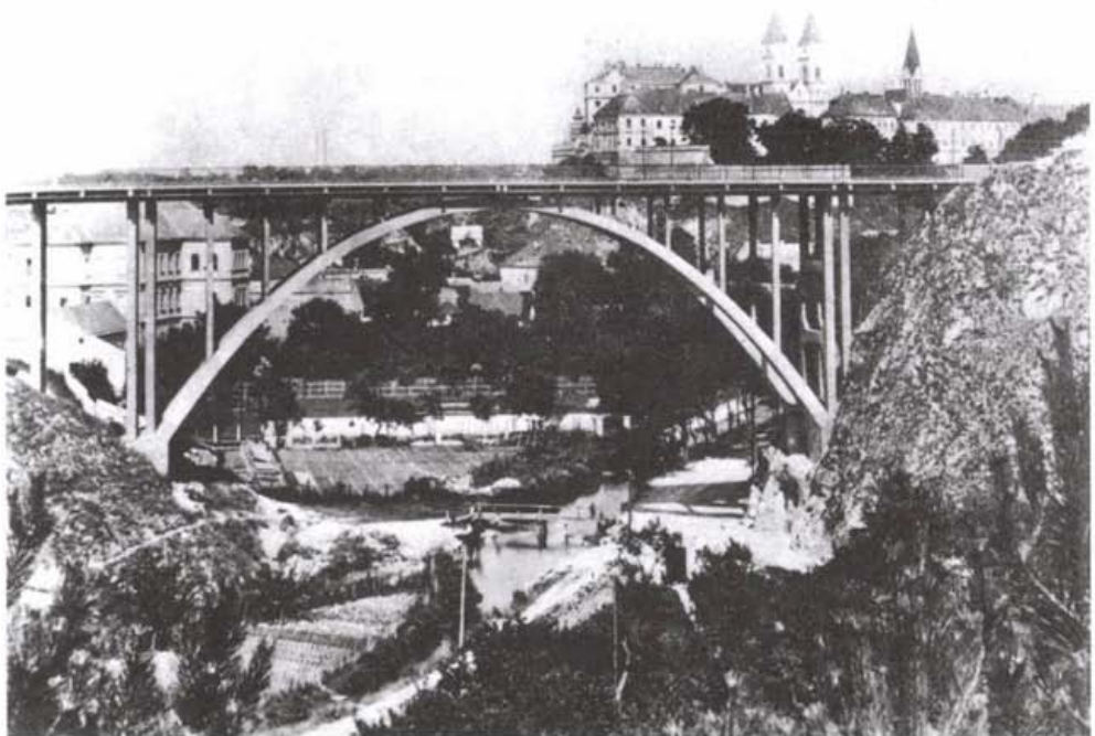
Veszprém, Völgyhíd (1938)

A honismereti mozgalmat én nemzeti tudatunk környezetvédelmének neveztem el, de a munkánk eredményét illetően nem volt teljes győzelmünk. Most éppen készül újra egy