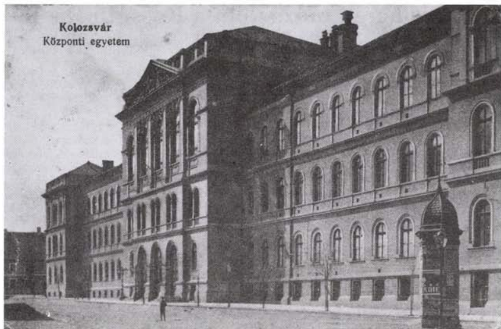
Kolozsvár, Központi Egyetem (1913)