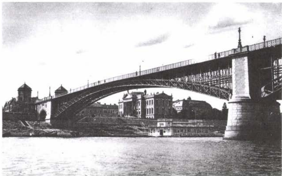
Szeged, Tiszparti részlet a híddal

évfordulójáról. Mindegyik település számotartja, hogy ki született ott, vagy ki kötődik oda, és ez is nagyon fontos.