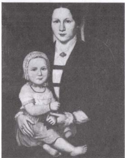
Váradyné Ruffy Ida és Gizella lánya (Simonyi Antal festménye, 1853.)

1846. május 22-én Dömsödről írt verses levelében (Levél Várady Antalhoz) a következőképpen inti Váradyt: