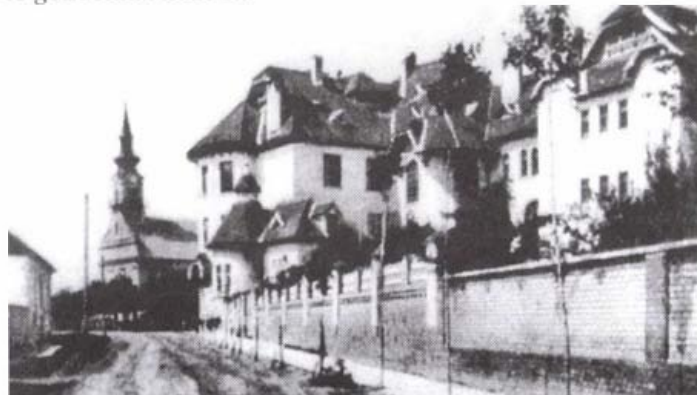
A polgári fiúiskola

Az 1914 nyarán kezdődött háború rövid helyi megtorlásnak indult és világháborúvá fejlődött. Az iskola tanulói honleányi buzgalommal kötötték a hősapkákat, érmelegítőket, harisnyákat. A kezdeti buzgalmat mihamar fáradtság, közöny váltotta fel. A tanulás feltételei rosszabbodtak, a szénhiány, könyv- és írószerhiány, a járványok közvetlenül, a ruha, cipő, élelmiszerhiány közvetve hatott az iskolai munkára. 1919 április végén a románok már lőtték a községet. Az utolsó háborús évben alig volt tanítás. A magyar, majd a román katonák költöztek be az épületbe. Hogy a tanévet befejezhessék, a tanárok kijártak a gyermekek lakására és ott segítettek a tanulásban. A fiúiskola hasonló gondokkal küzdött.