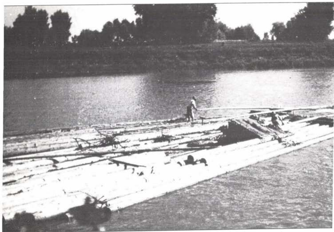
Tutajozás a Tiszán, 1930-as évek