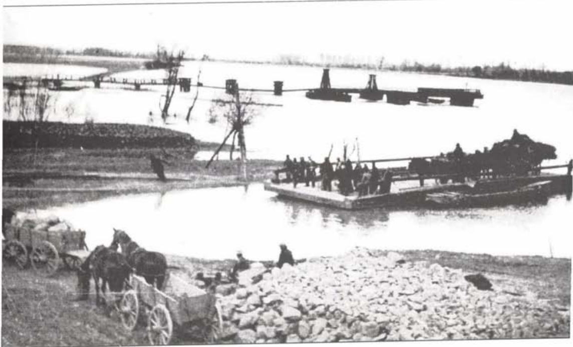
Komp a későbbi fahíd helyén árvízkor, 1937.