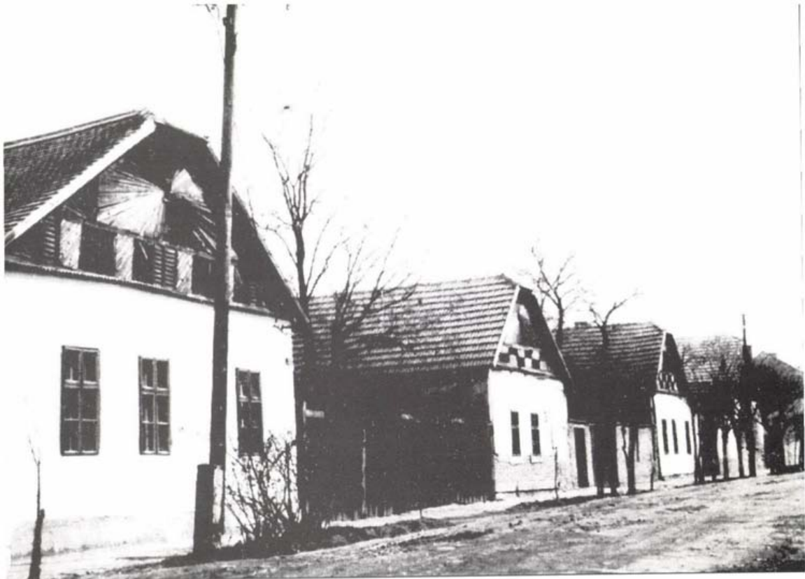
Ősözkei utcásor