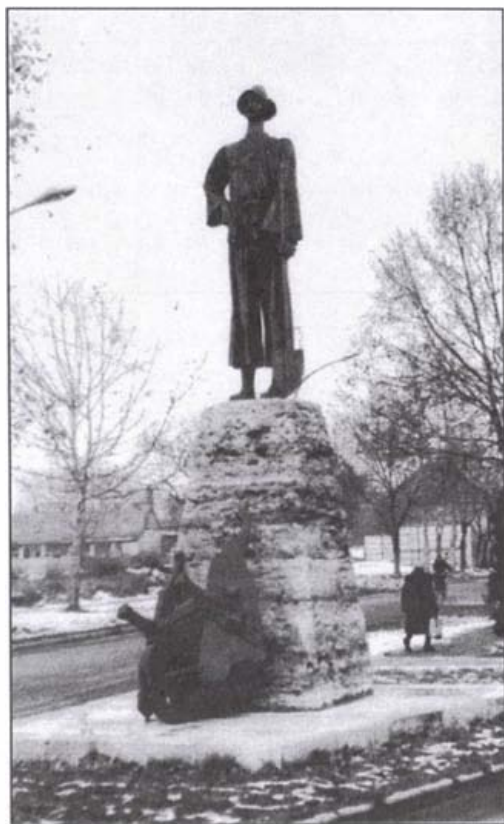
Tóth Béla kubikus szobra. 1979.

A kubikolás minden kezdeti formája előbb helybeli, majd idővel ingázó vándormunkát jelentett: a bányászokéhoz hasonlóan nehéz foglalkozást elsősorban felnőtt férfiak űzték, csak elvétve segítettek nők és erősebb gyermekek ún. csikókként pl. a talicska vontatásában. A kubikosok inkább paraszti eredetű szerszámaik tökéletesítésével könnyítették és gyorsították munkájukon. Így kézbeli szállítóeszközüket, a paraszti ládás talicskát úgy alakították át, hogy a végén a teher kétharmada a kerékre esett, sőt még a kezek terhelésén is tudtak ún. hámmal vagy nyaklóval könnyíteni. Az újításban a szentesiek és a csongrádiak jártak az élen, a többi helység kubikosai kisebb-nagyobb késéssel követték őket. E talicskatípust 1945 után szabványosították, és a magyar mérnökök még Koreában és másutt is megismertették a földhordó munkásokkal. Bár az itáliai Pó folyó völgyében is kialakult a sterratore -nak nevezett kubikosság, talicskáik messze elmaradtak a szentesi-csongrádi típus mögött, hasonló a helyzet a munkaeszközökkel is.