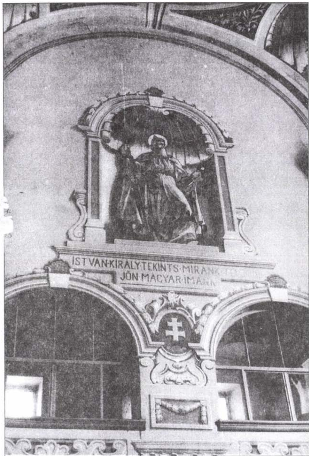
Nagyboldogasszony temploma. Épült 1762–1769 Csongrádon.