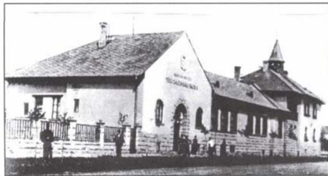
A téli gazdasági iskola

Az intézmény az elemi iskolát végzett gazdaijak képzésével foglalkozott. A kétéves, és évenként két félévre osztott tanítás elméleti része november elején kezdődött és március közepéig tartott. A gyakorlati részt minden tanuló a saját gazdaságában végezte március közepétől október végéig, ahol a helyszínen keresték fel őket az iskola szaktanárai és adták meg mindenkinek a saját gazdasági viszonyainak megfelelő szaktanácsot. A felsőévesek a második gyakorlati félév végén versenykiállítás rendeztek, ekkor kapták meg a végbizonyítványt és aranykalászos gazdákká avatták őket. Minden tanuló tagja volt az iskolában működő gazdakörnek. Évi négy pengő díj ellenében megkapták az összes tankönyvet, fűzetet, írószereket.