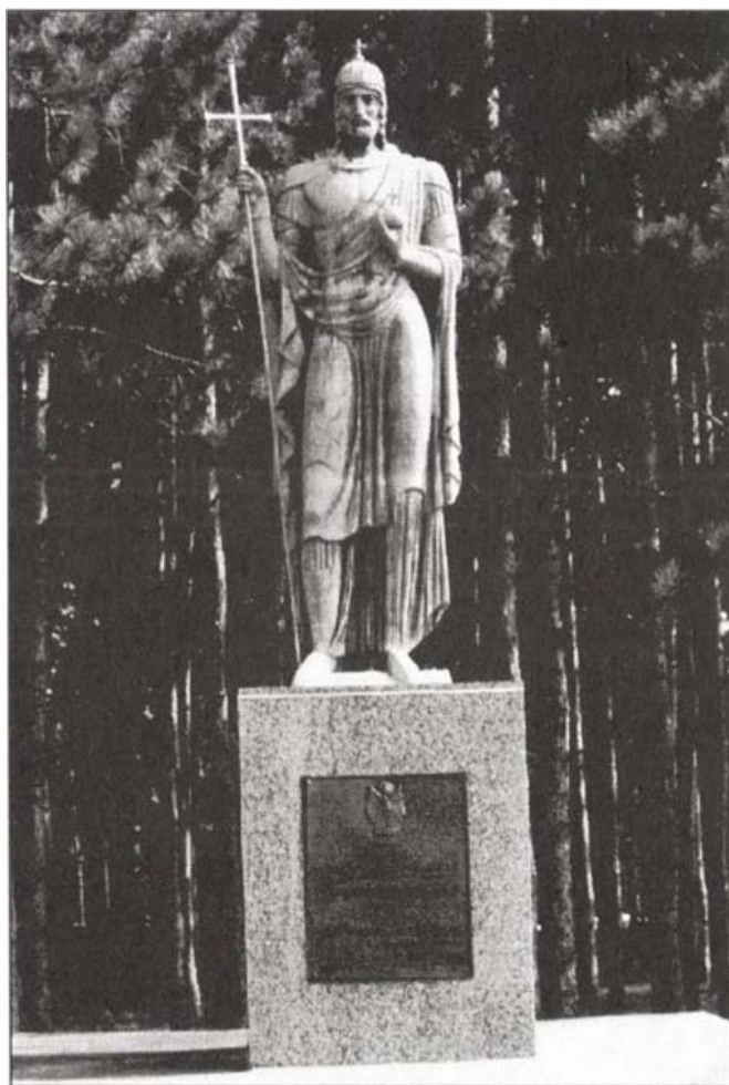
Rumi Rajki István: Szent István (USA. Ohio állam, Youngstown)