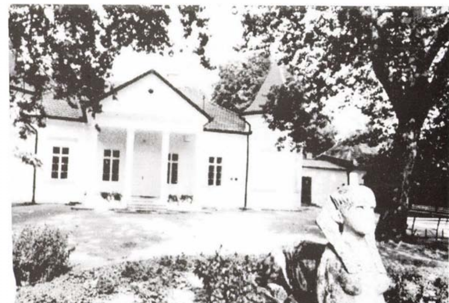
A tápiószelēi Blaskovich-kúria, ma Múzeum