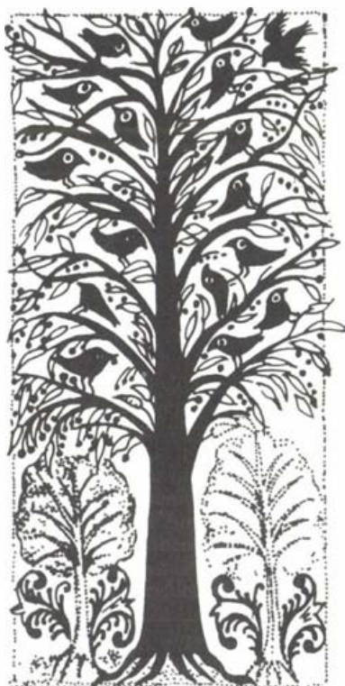
Életfa – a noszvaji ref. templom mennyezetének részlete, 1734. (Székely Judit rajza)

A figyelt újságok: Dél-Magyarország (DM), Észak-Magyarország (ÉM), Fejér Megyei Hírlap (FMH), Hajdú-Bihari Napló (HBN), Heves Megyei Hírlap (HMH), Kalocsai Néplap (KaN), Kelet-Magyarország (KM), Kisalföld (KA), Köznevelés (KN), Magyar Fórum (MF), Magyar Nemzet (MN), Napló (Na), Népszabadság (N), Népújság (Tolna) (NÉT), Nógrád Megyei Hírlap (NMH), Országhatár (OH), 24 óra (O), Pápai Hírlap (PáH), Pest Megyei Hírlap (PMH), Pesti Hírlap (PH), Petőfi Népe (PN), Sárvári Hírlap (SáH), Somogyi Hírlap (SH), Új-Dunántúli Napló (ÜDN), Új Magyarország (UM), Új Néplap (ÜN), Vas Népe (VN), Vásárhely és vidéke (VV), Világszövetség (V), Zalai Hírlap (ZH).