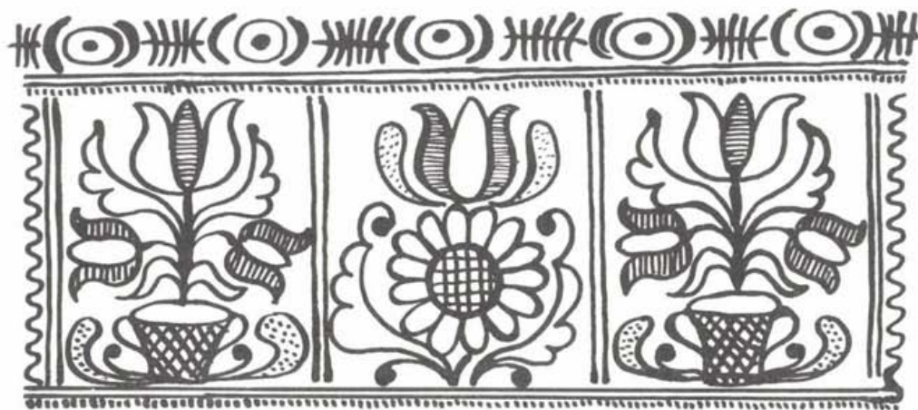
Korondi kazettás díszítésű bokály részlete (Szekely Judit rajza)