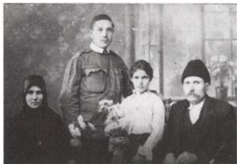
A Szántai család katonafiúkkal az I. világháború idején