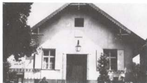
A fehéregyházi Petőfi-múzeum ma, 1991. július