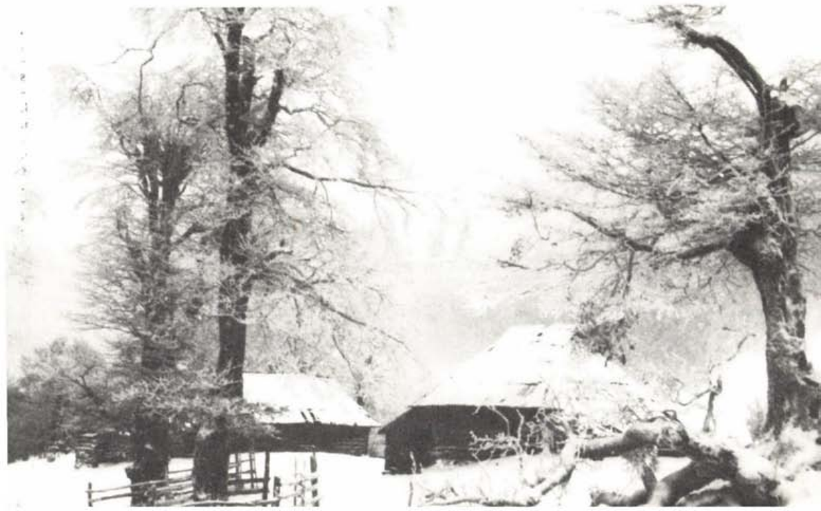
Esztena a vulkáni havasokban