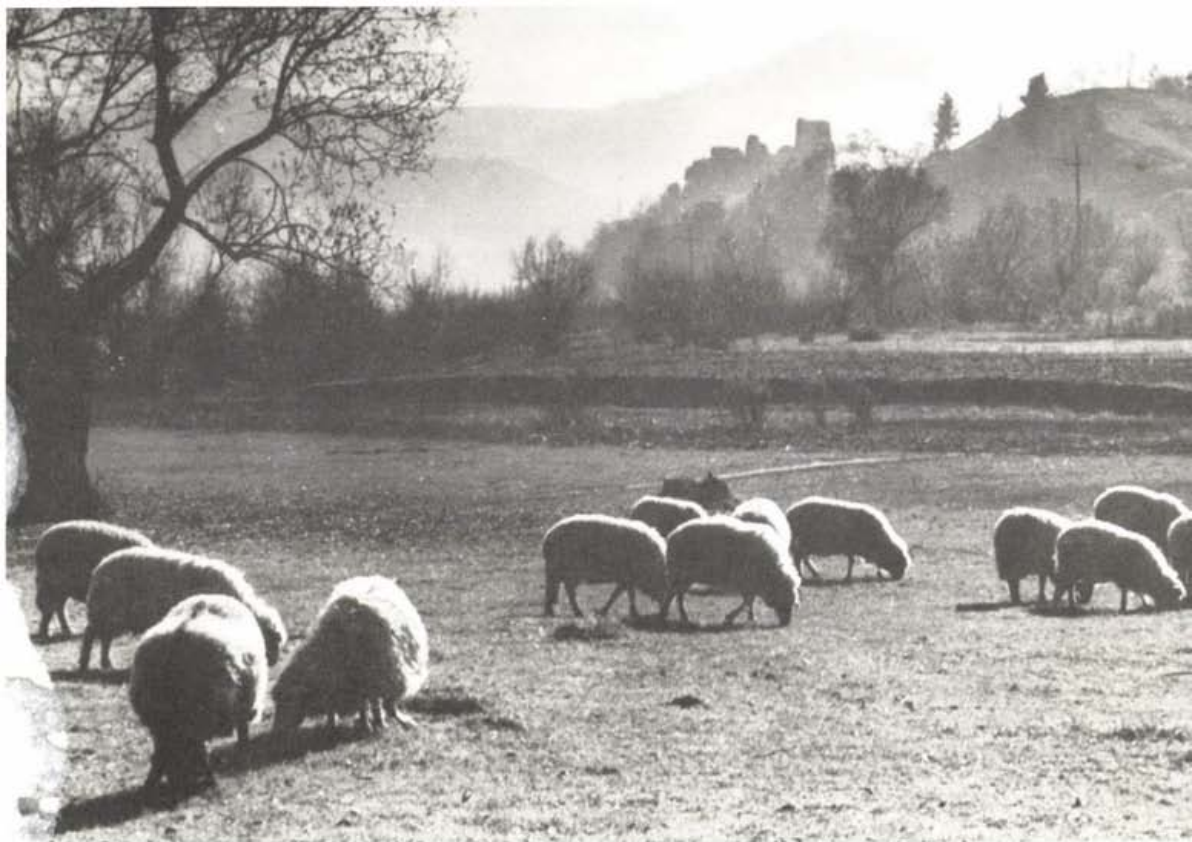
bes vára