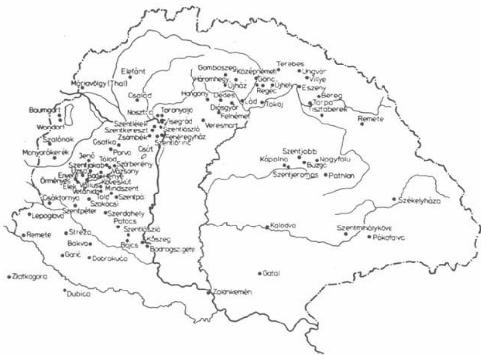
Pálos kolostorok Magyarországon 1514-ben (Hervay Ferenc: Ordo Fratrum Eremitarum Sancti Pauli )

főherceggel és Pfeiffer Gyula miniszteri főtanácsossal az élen megalakult a Szent Gellérthegyi Sziklatemplom (Lourdes-i Barlang) Bizottság . Ezzel kezdetét vette a sziklatemplom története.