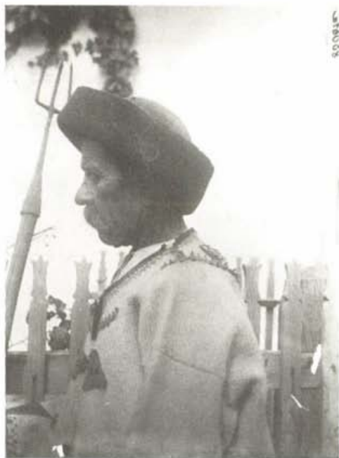
Öreg halász szigonnyal, Szentlászló, 1910