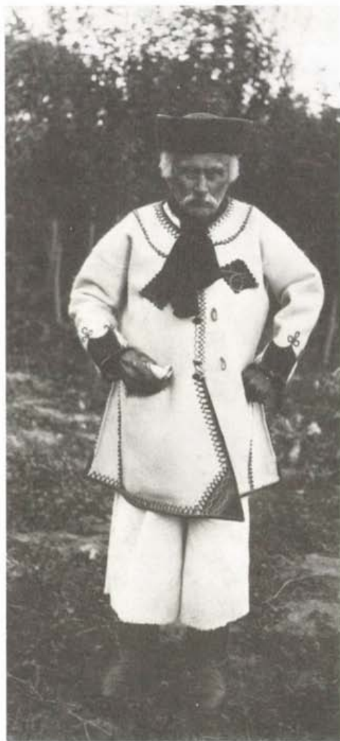
Idős magyar férfi ünnepelőben, Haraszti, 1910