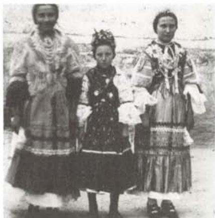
Ünnepi viseletben, Haraszti 1910