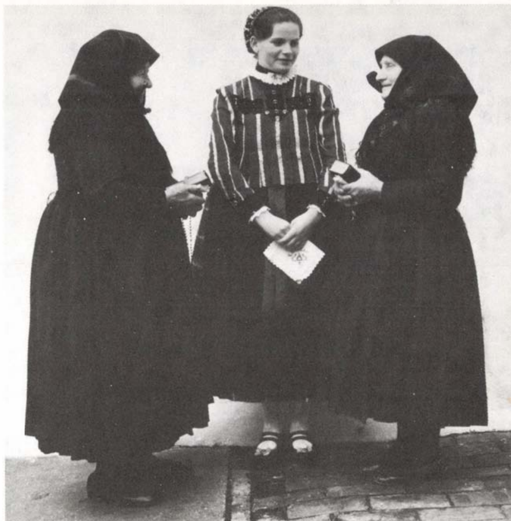
Kisnyéridi németek

ható szükségességük ellentétben áll a betelepített székelyek – a „külső csoport” – jellemzésénél konstatált bőbeszédűségükkel, ismereteik sokrétűségével. De úgy tűnik, ezek a csekély számban felsorolt jellemzők is joggal emlékeztetnek arra a kutatók által leszögeezett tényre, hogy saját csoportunkat hajlamosabbak vagyunk kedvezőbben értékelni, mint egy külső csoport tagjait.