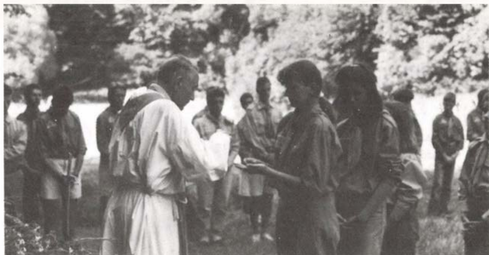
Tábori szentmise egy mecseki cserkész táborban 1991 nyarán

magyar nyelvet, irodalmat, történelmet, földrajzot, néptáncot és népzénetet tanulnak a fiatalok. 1964-ben alapították az USA-beli Fillmore mellett a Sik Sándor Cserkészparkot, ahol a vezetőképző táborokon kívül minden évben magyarságtanulmányi táborokat is szerveznek. Ezek magyar érettségi vizsgákkal fejeződnek be.