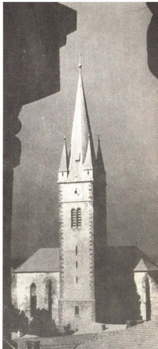
A XIII–XIV. században épült tordai református templom