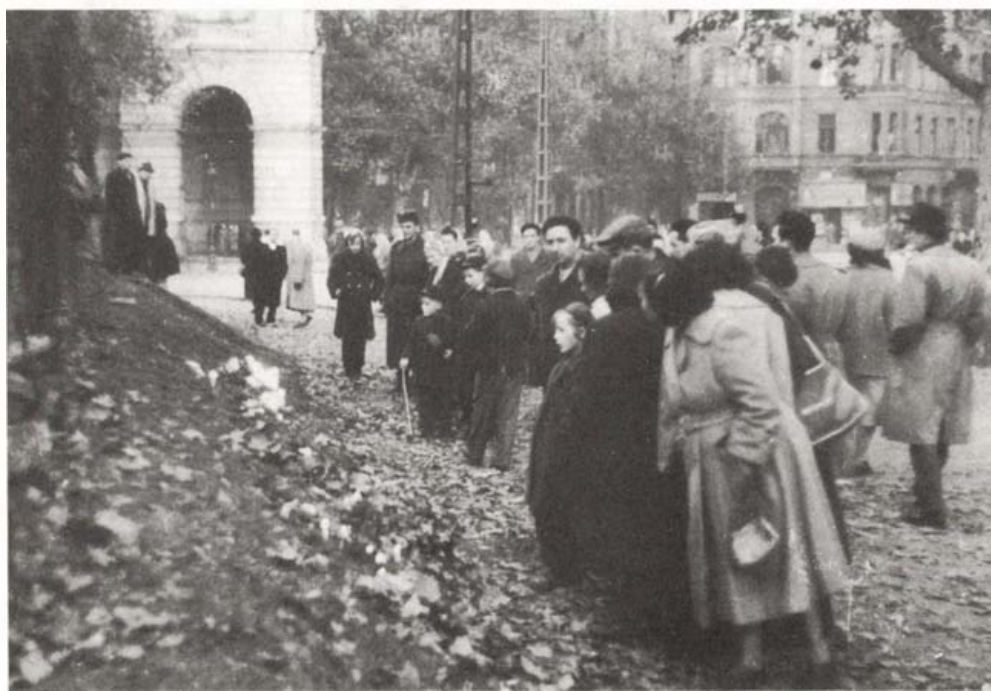
1956. október 26. Gyertyák égnek a sortüz áldozatainak emlékére