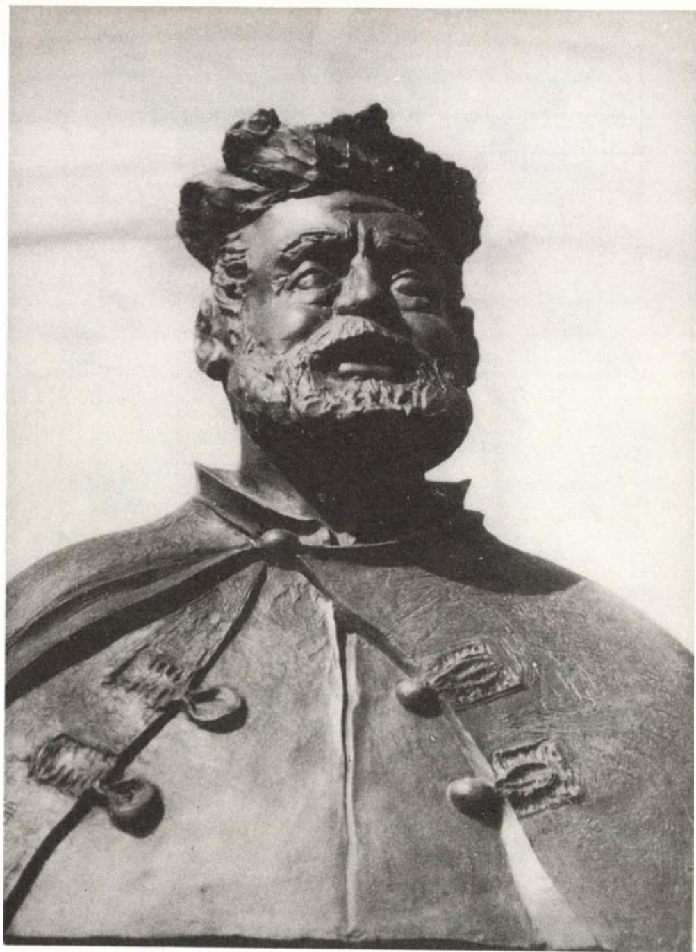
Kiss György altábornagy szobra Körösnagyharsányban.