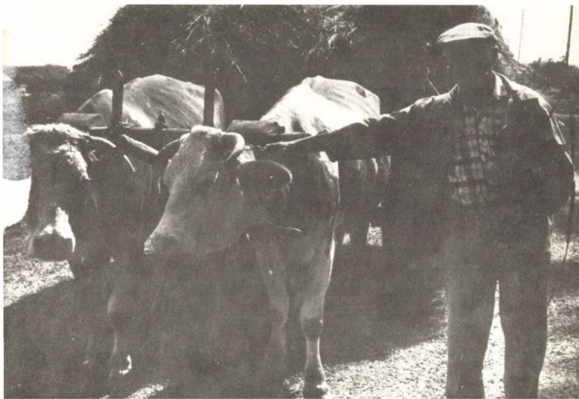
Szénaszállítás tehenes fogattal, Kőrösnagyharsány