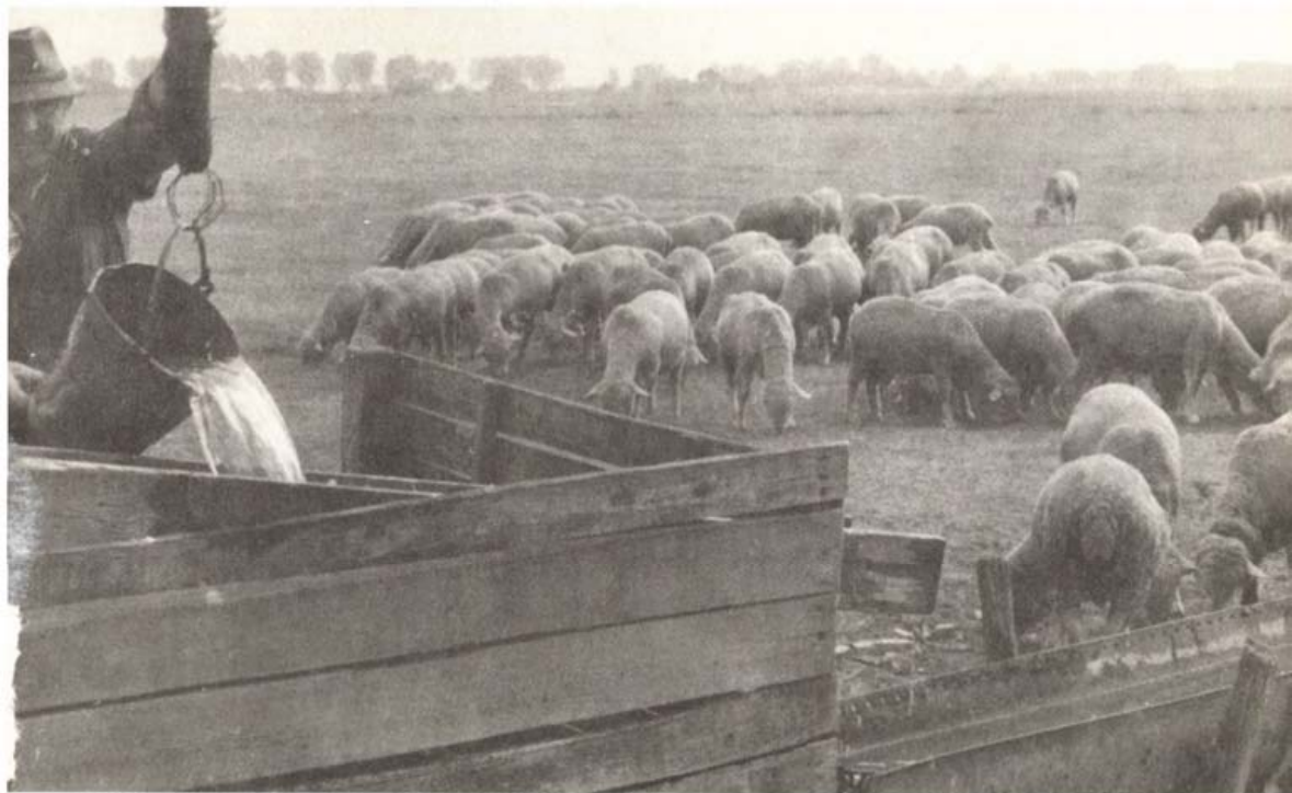
Vésztői juhász