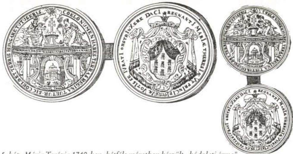
5. kép. Mária Terézia 1740-ben, kétféle méretben készült „hódolati érme”

1765-ben a nagyfejedelemségi diplomán jelent aztán meg a tanulmány elején leírt és fogzó holdsarlót mutató címer. Dacára e címermeghatározásnak, Mária Terézia összes 1765 után vert pénzérméjén növény hold látható többnyire kétféjű sas mellén viselt pajzsokon, apróbb pénzekben néha sas nélkül.