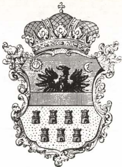
Erdély címere a nagyfejedelemségi oklevélen

Mária Terézia 1765. november 2-án Erdélyt nagyfejedelemséggé nyilvánította. Erdély címerének leírása az 1765. évi Nagyfejedelemségi Oklevél alapján a következő: vörös vágásközzel kettéosztott mező (a vágásközt helytelenül keskenypólyának vagy gerendának = Querbalken is nevezték), fent kékben arannyal fegyverezett növekvő fekete sas, amelyet a felső jobb sarokban sugaras arany nap, a felső bal sarokban fogyó ezüst holdsarló kísér: lent arany mezőben hét (felül négy, alul három) vörös bástya két oromsorral – a felső három-, az alsó négyormú –, továbbá két ablakkal és egy kapuval. A pajzsos a nagyfejedelemségi korona nyugszik. (1. kép)