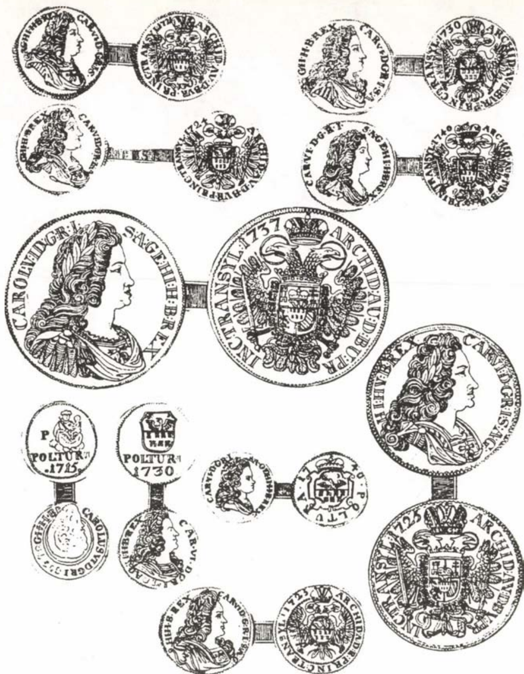
4. kép. III. Károly 1720 után vert érmei

Mária Terézia 1740-ben, kétféle méretben készített „hódolati érmén” Erdély címerének merőben új ábrázolásával találkozunk: két mezőben behajló arany sátor (ék), jobbra fent sas, fejével balra néz (eltérően a megszokottól), balra fent nap és növekvő holdsarló, az éken a hét torony három oszlopban (2, 3, 2 elrendezésben) áll. 10 (5. kép)