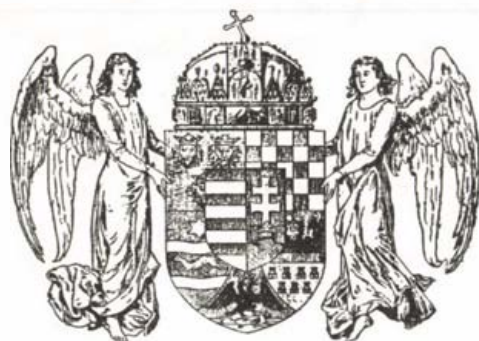
8. kép. Az 1896-ban megállapított magyar országos címer

Az 1874. február 9-i királyi leirat alapján elkészített középcímer szív-pajzsában a kiscímer, jobb felső sarkában Dalmácia, alatta Szlavónia, bal oldalt fent Horvátország, bal oldalt lent Erdély, alul ékben Fiume. Erdély címerén a holdsarló fogyó . 12 (7. kép) Nem így az ún. millenniumi középcímeren, ahol növő holdat láthatunk. Erdély címere a nagypajzsnak ugyanarra a helyére került, mint az előbbinél. 13 (8. kép)