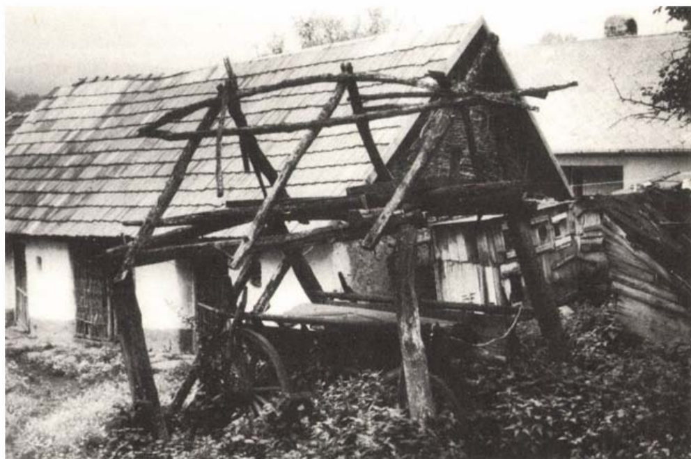
Ipolyfödemesi udvar

MEZŐCSÁTI Helytörténeti és Néprajzi Diákmunkaközösség, Mezőcsát: Étkezési szokások, régi ételek (P. 181.).