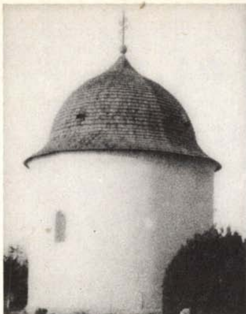
A kör alakú rotunda a templomkertben