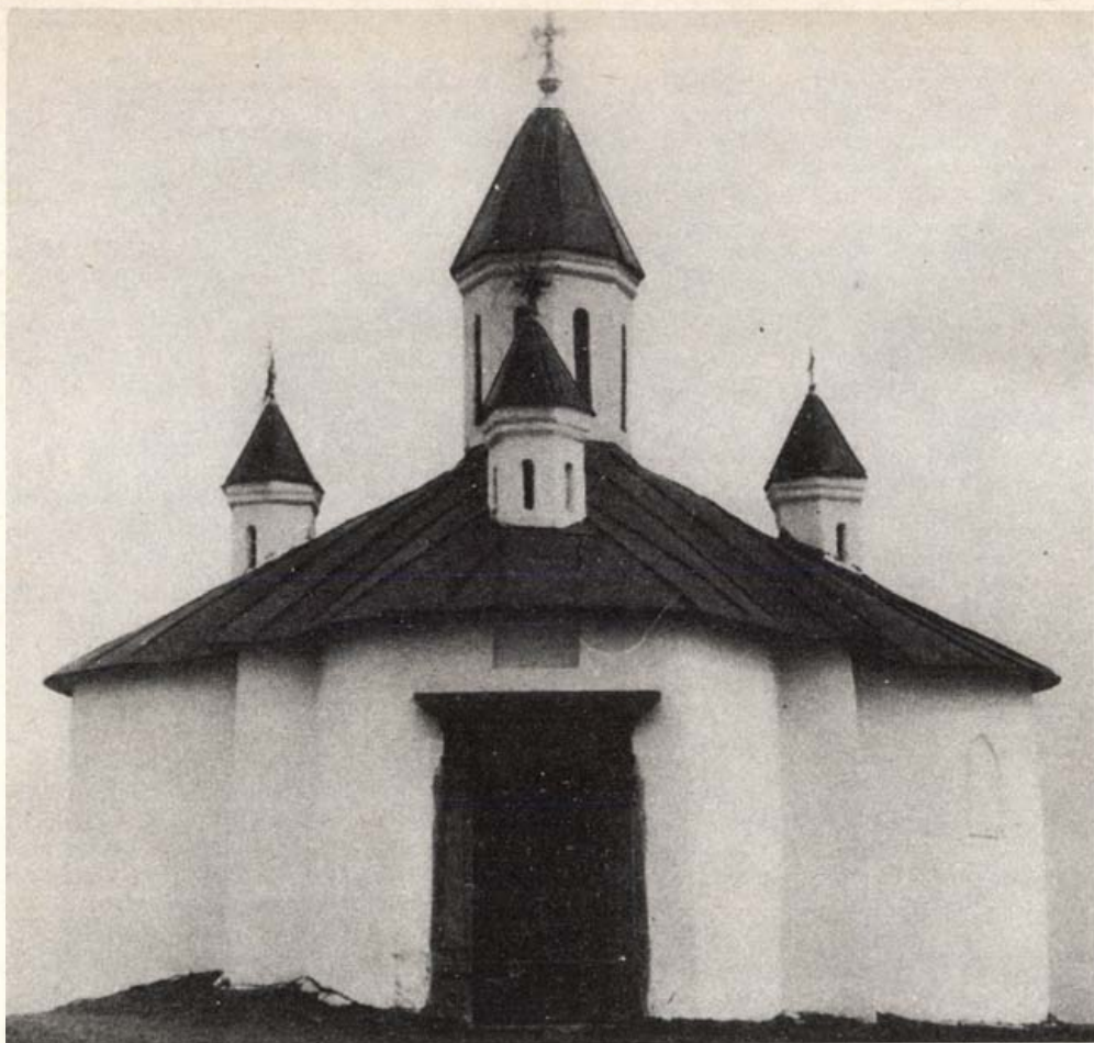
Kézdiszentlélek–Perkő, római katolikus Szent István kápolna

nyugati határvidékeken, Biharban és természetesen Erdélyben. A székelység zöme legalább a XI. sz. eleje óta lakja Erdélyt, igaz a jelenlegi lakóhelyüktől eltérő területen, mely a XIII. sz. előtt a mai Szászvárostól (Orăștie) hosszú sávban húzódott kelet felé az Olt kanyarulatáig, északon pedig a Maros középső szakaszának vonaláig. Egy részük a Sebes patak torkolatvidékén a későbbi Szászsebes, illetve Szászorbó és Szászkezd környékén élt.