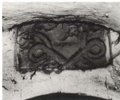
Sepsikilyén, unitárius templom; késő gótikus kötőredék

A székelyek XIII. sz.-i betelepítését követő első nagy, valószínűleg szervezeten folyó építési hullám eredményeként a későbbi Háromszék területén legalább 45 templom