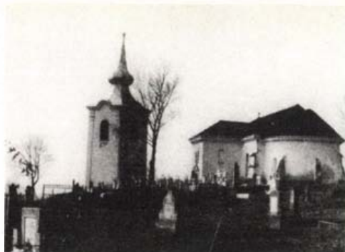
Réty, református templom