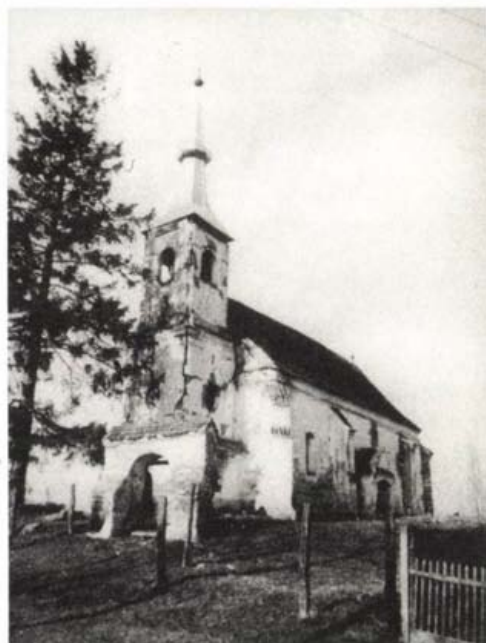
Sepsikilyén, unitárius templom