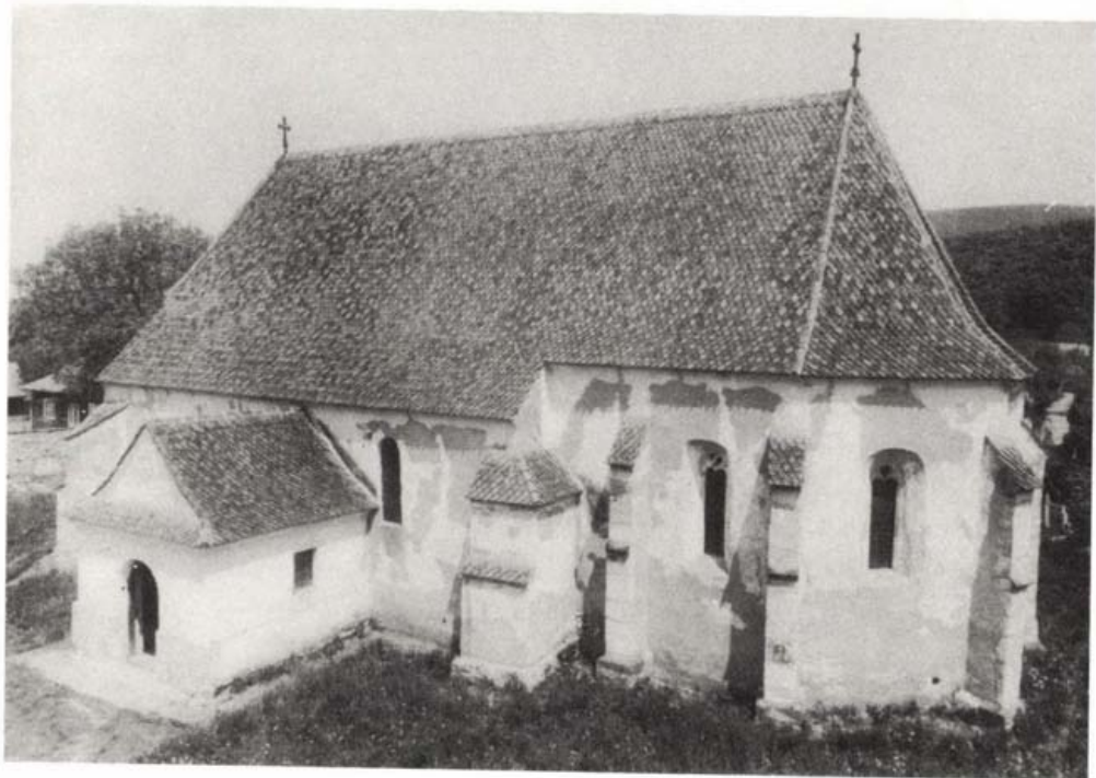
Gelence, római katolikus templom