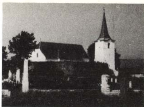
Gidófalva, református templom

Ezek az Erdély-szerte a XIII. sz.-ban meghonosodott egyszerű alaprajzú, téglány alakú hajóból és szabálytalan félköríves záródású szentélyből álló, torony nélküli templomtípust képviselik.