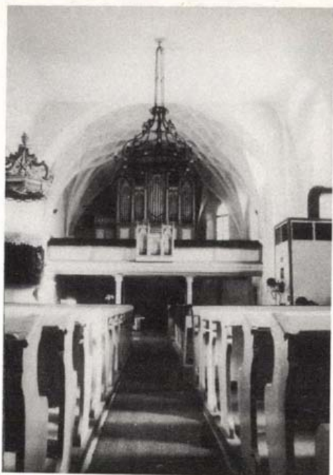
Sepsziszentgyörgy, református templom