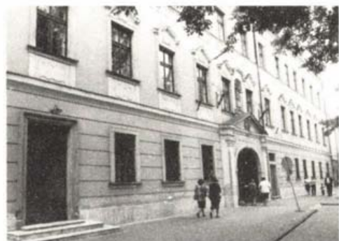
Az angolkisasszonyok új otthona Egerben, mely egykor is a rend működését szolgálta