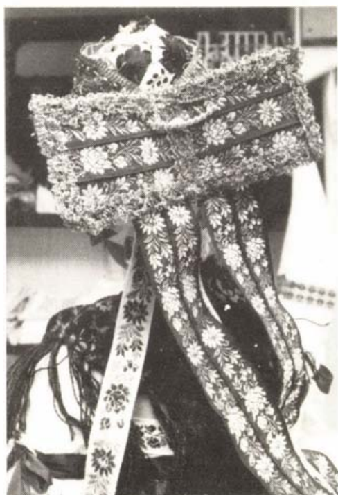
Homokterenyei főkötő