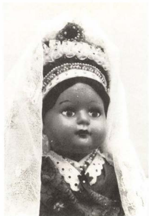
Homokterenyei újmenyecske viseletének gangója és kelléke