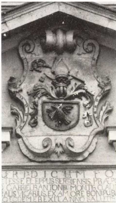
Címer a főbejárat fölött

Újra lehetőség lesz Egerben a katolikus iskolák beindítására. Ennek első állomásaként szeptember 16-án dr. Seregély István egri érsek, a magyar püspöki kar vezetője, a ferences templomban szentmisén emlékezett meg az angolkisasszonyok áldozatos munkájáról, majd megszentelte a Szilágyi Gimnázium szomszédságában lévő – most visszakapott – angolkisasszonyok kollégiumát. A 8 osztályos gimnáziumban ebben a tanévben egyelőre egy osztályt indítottak 40 tanulóval.