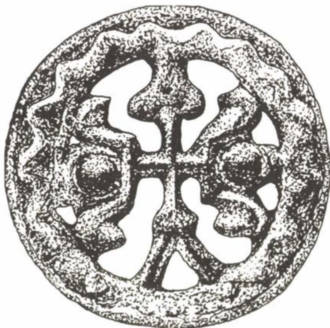
Késő avar kori bronz-karika, Toponár (Hornják László rajza)