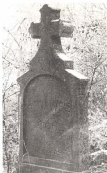
Stohl Anna sírja az isztiméri temetőben, 1990.