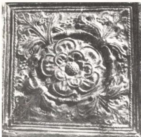
Reneszánsz kályhacsempe Mátyás tatai palotájából (Kuny Domokos Múzeum, Tata)

Mátyás kedvenc vitéze, Bajnai Both András faragtatta a bajnai templom szentségtartó fülkéjét.