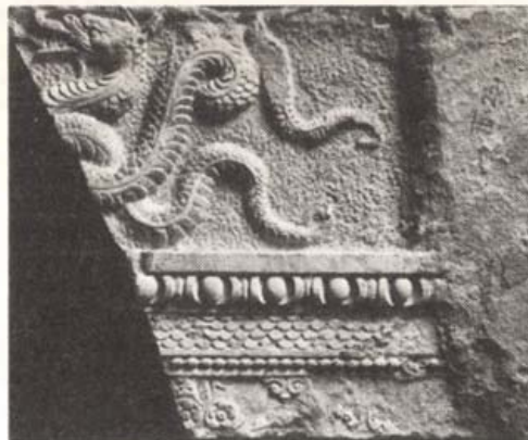
Friz sárkány töredékével (fehér budai márga)

római Corvinus nemzetségig, legalizálja többek között Mátyásnak azt a törekvését is, hogy felülmúlja a római császárok építkezéseit.