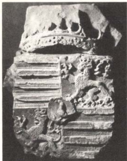
Mátyás király címere a budai várból (mészkö)