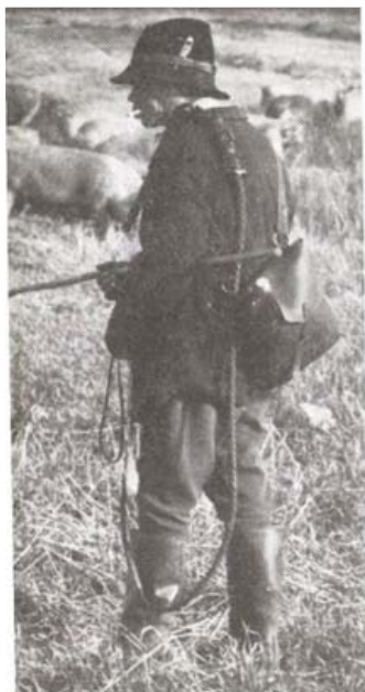
Kondás a Hortobágyon (1980)