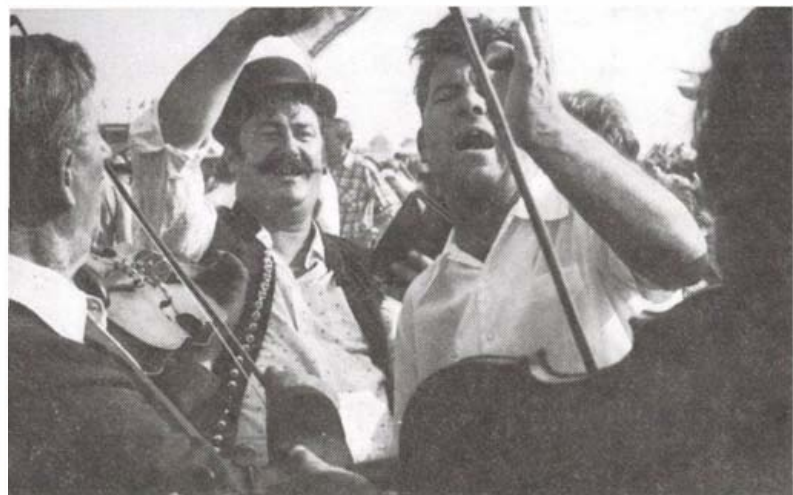
A hidi vásárban (1981)