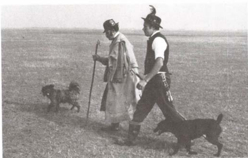
Az angyalházi legelőn, Hajdúszoboszló határában (1983)