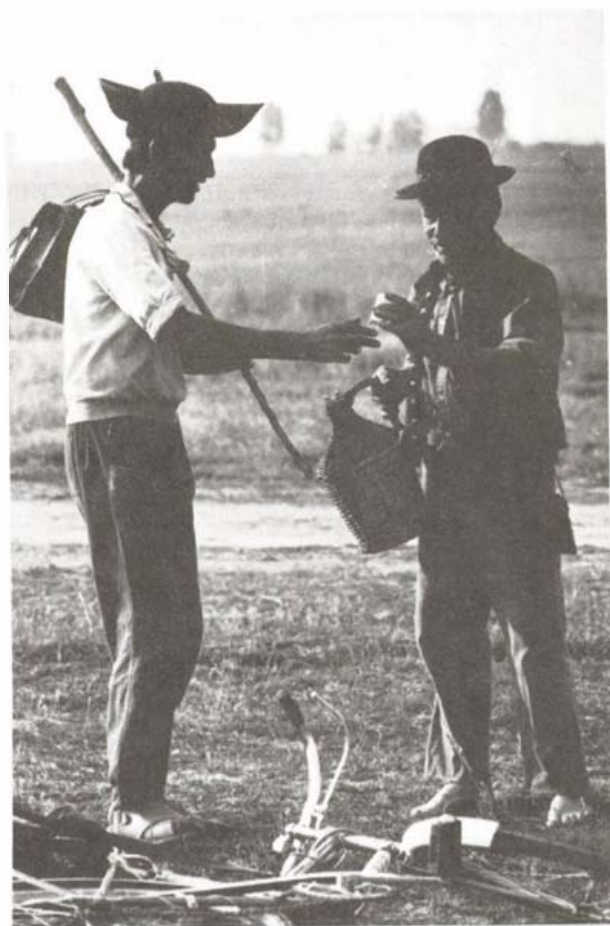
Barátkozik a csordás és a juhász a tiszaszőlősi legelőn (1982)