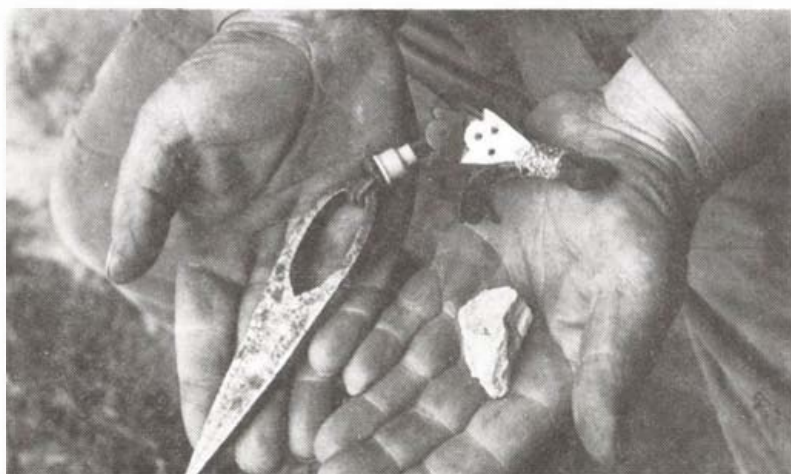
Tűzszerszám: acél és kova (Derecske, 1978)