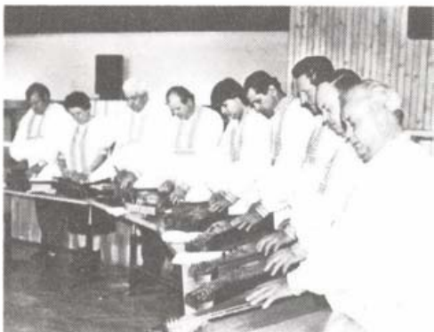
A göntérházi citerások

közösség közgyűlésének elnöke ismertette a Lendva környéki magyarok helyzetét és mutatta be a fellépő együtteseket. A rendezvény előtt és után a közönség gyönyörködhetett a pincei hímezőkör asszonyainak rögtönzött népművészeti kiállításában. (Halász)