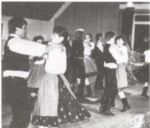
A dobronaki táncosok