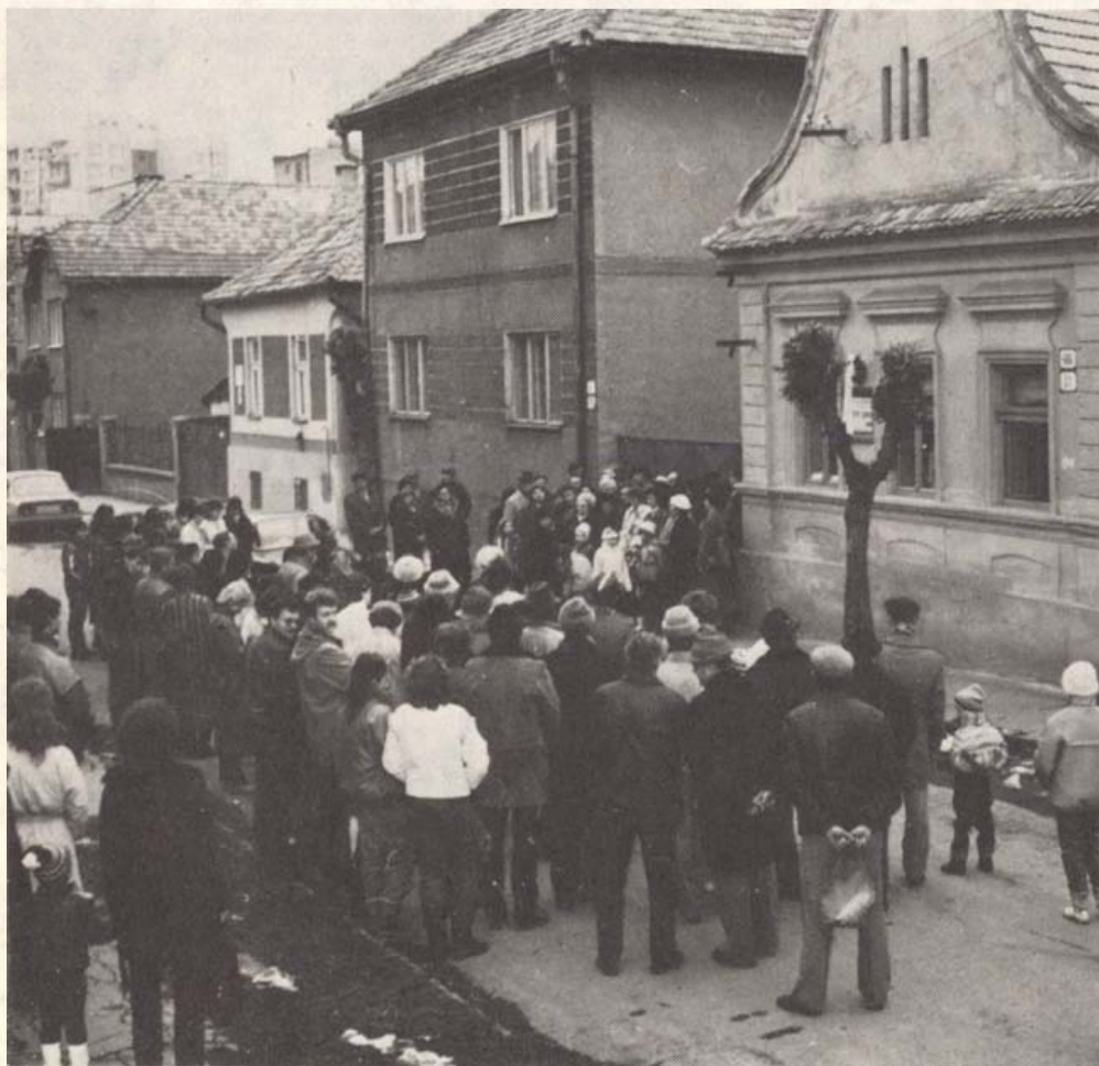
Ünnepség a Petöfi-háznál 1988. március 15-én