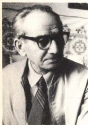
Horváth József önarcképe