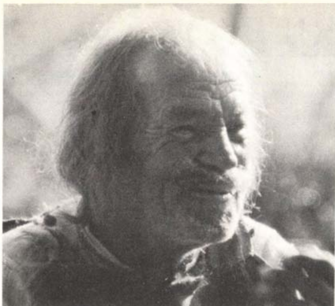
Havasai román pásztor a Déli-Kárpátokban

feleségül, ott telepedett meg évtizedekre, ott született a leánya, a havasali emberek szokásaihoz igazodott életformájában, gondolkodásában, szórakozásaiban.