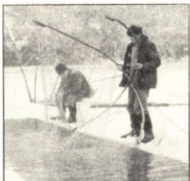
Jégről való halászat a Latorcán: a lék kivágása után vízbe helyezik a varsaszákot

A horgos halászat másik formáját, az átkötő (átkötő) horgászatot a szirénfalviak egykor a szegedi halásztoktól tanulták, akik nyár idején eljutottak egészen a szirénfalvi határig. Az átkötő horgászat alapelve, hogy egy huzalt feszítenek ki a két part között, s a huzalra egymástól kb. méterenként másfél-kétméteres, végeiken horgokkal ellátott zsinórt erősítenek, melyekre felváltva különféle csalétket (kishal, kukorica-