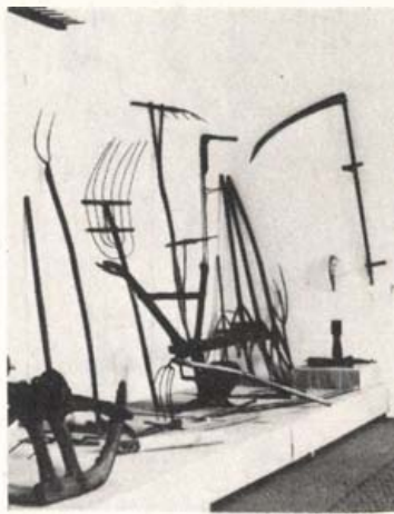
A betakarítás eszközei

1976. október 10-én nyílt meg Somorján, (Samorin), a Felsőcsallóköz e réges-régi városkájában a Honismereti Ház. A meghívó szerint akkori védnökei a Csemadok városi szervezete és a Somorjai Városi Nemzeti Bizottság voltak. 13 helyiségben, 500 négyzetméternyi alapterületen láthatta a látogató azt a gyűjteményt, amely képet adott a város történetéről, munkaszorgalmi hagyományairól és néprajzi emlékeiről. Mindez ötezer munkóra eredményeképpen jött létre. Külön helyiségben kaptak helyet Somorja szülöttének, Tallós Prohászka István festőművésznek a képei, amelyeket hozzátartozói ajándékoztak a városnak.