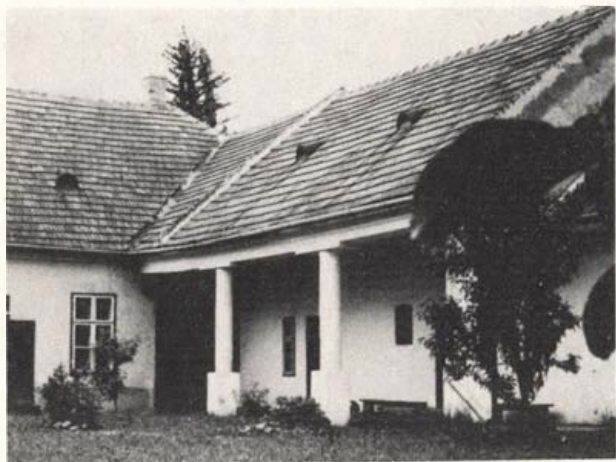
A somorjai Honismereti Ház az udvar felől