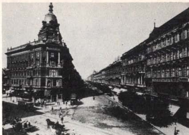
Korabeli felvétel a Foncière Biztosító Intézet palotájáról