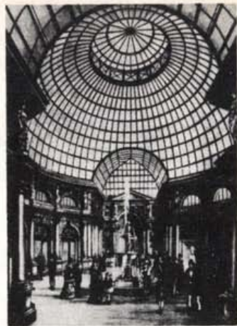
A Haris-bazár teljes pompájában

pompásabb luxus építménye volt, a korabeli fényképek és apámék elbeszélései szerint is. A mostani Párizsi átjáró elbűnhat mellette.” 5