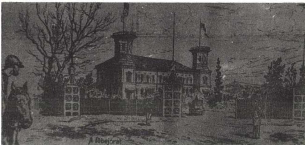
Az új lóversenypálya

uradalmát, melyet nagy szaktudással és igyekezettel mintagazdasággá fejlesztett. A birtokon nagy mennyiségű tőzeget talált, amit papírgyártásra próbált felhasználni. A másra használhatatlan tőzegeből csomagoló- és lemezpapírt készített, és a technológiai eljárást szabadalmaztatta is. A megfeszített munka azonban csak sietette szívbjának kifejlődését és annak lett áldozata.