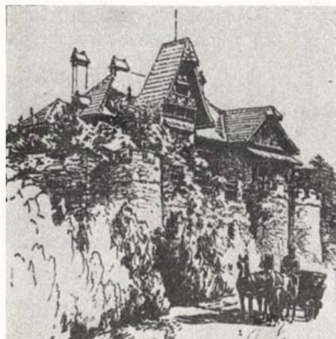
Saját tervezésű tatai, tóparti várkastélyszerű vil-lája (korabeli rajz)