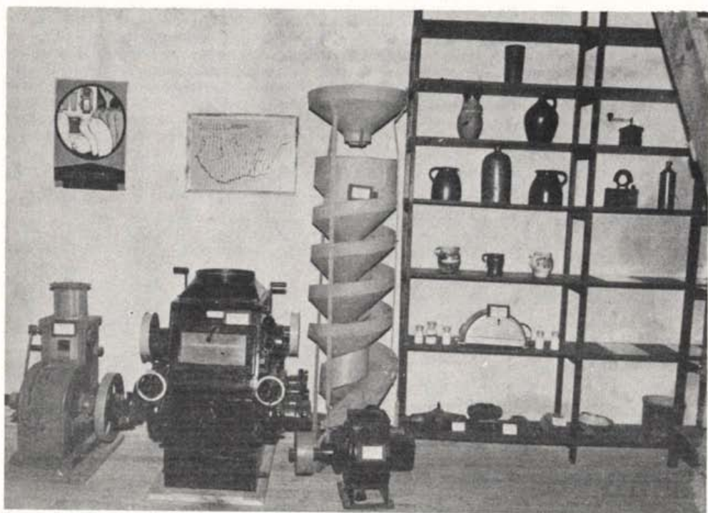
Részletek a csopaki vízimalom hely- és malomtörténeti gyűjteményéből.